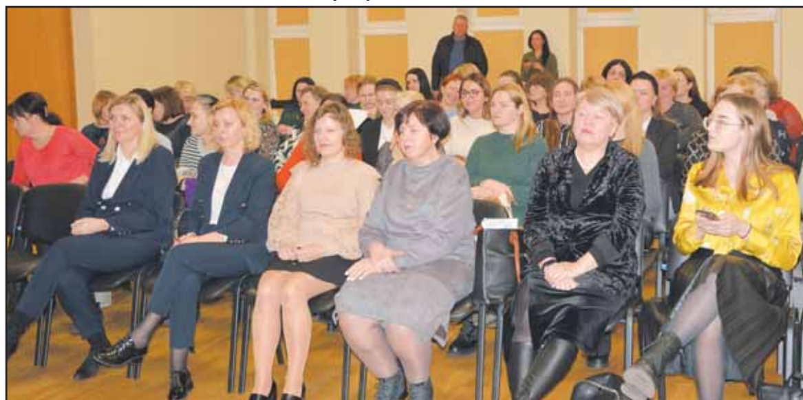
Prienu socialinių paslaugų centro darbuotojų atskaitiniame susirinkime.