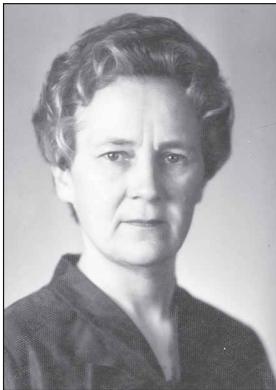
Peržengus gyvenimo penkiasdešimtmečio slenkstį.

Mena miela Didalija ir tai, kad drauge su vyru be galo mylėjo gamtą ir negalėjo suprasti, kaip reikia gyventi, kai negalės išvykti kartu į žvejybą ar grybauti. „Abu žvejodavom,