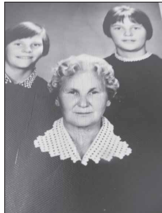
Su artimiausiu išsaugotu ryšiu, nors toliausiai, Amerikoje, gyvenančiomis dukterėčiomis.

...Galėjom dar kalbėtis ir kalbėtis, bet atėjo laikas ir skirtis. Nuoširdus aciū gerbiamai Didalijai už pasi-