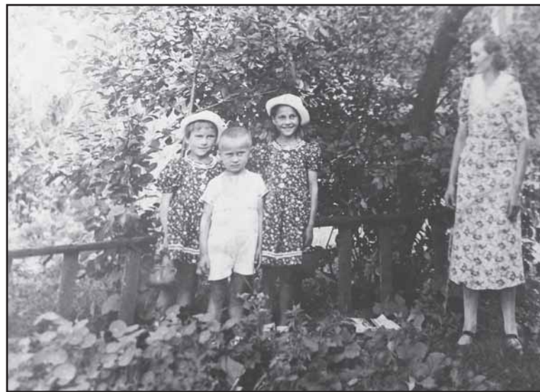
Vaikystė su mama, sese, broliu.

dalintas mintis, už pamokas mokėti ir kenčiant džiaugtis. Lai audžia dar gyvenimas ilga, sveikatos kupiną gerų kaimynų ir žmonių draugija dos-