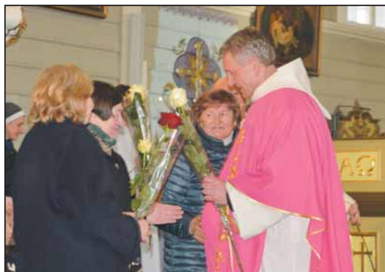
Kleboną sveikina „Gyvojo rožinio“ grupės narės.