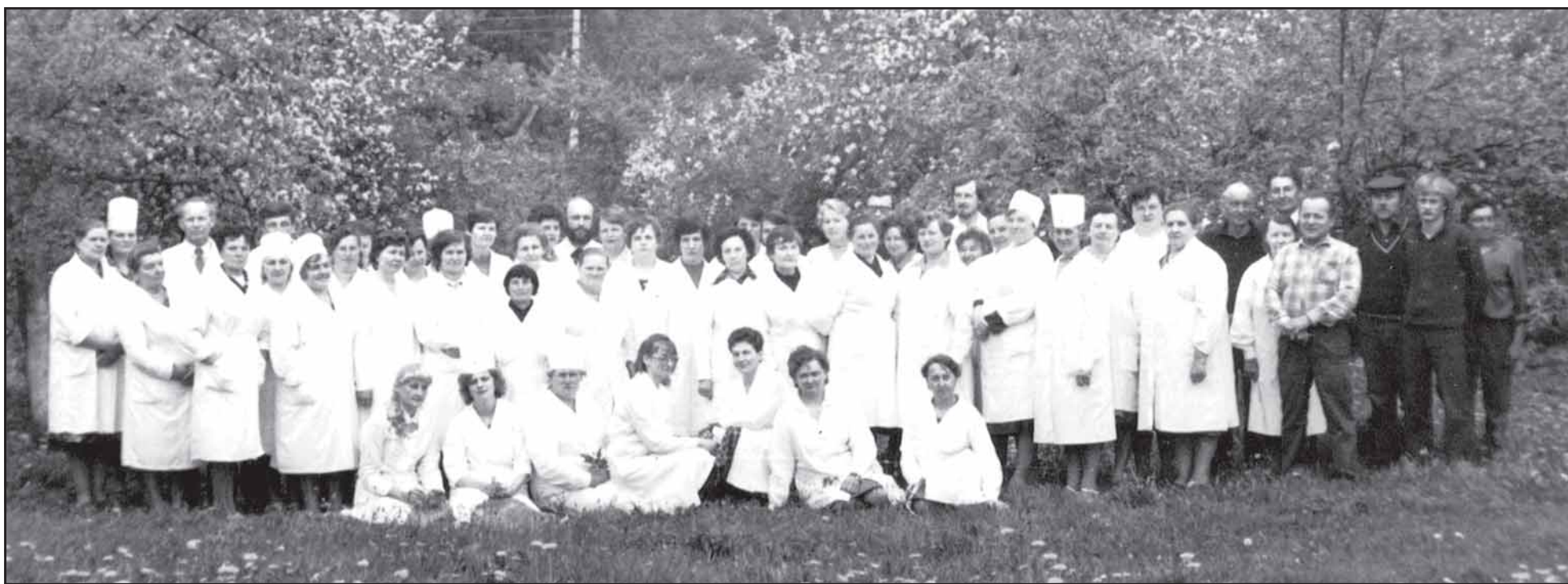
Jiezno ligoninės kolektyvas 1986 m. birželį.