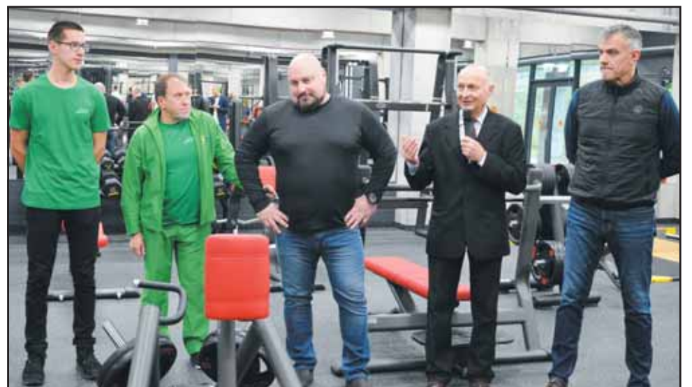
Birštono sporto centro treneriai pasiruošę instruktuoti klientus.