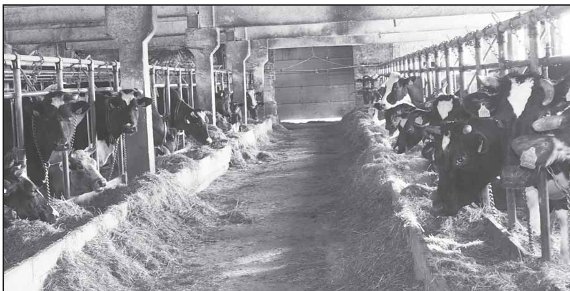
Jono Padelsko ūkio karvės tvarte – tik laikinos viešnios.