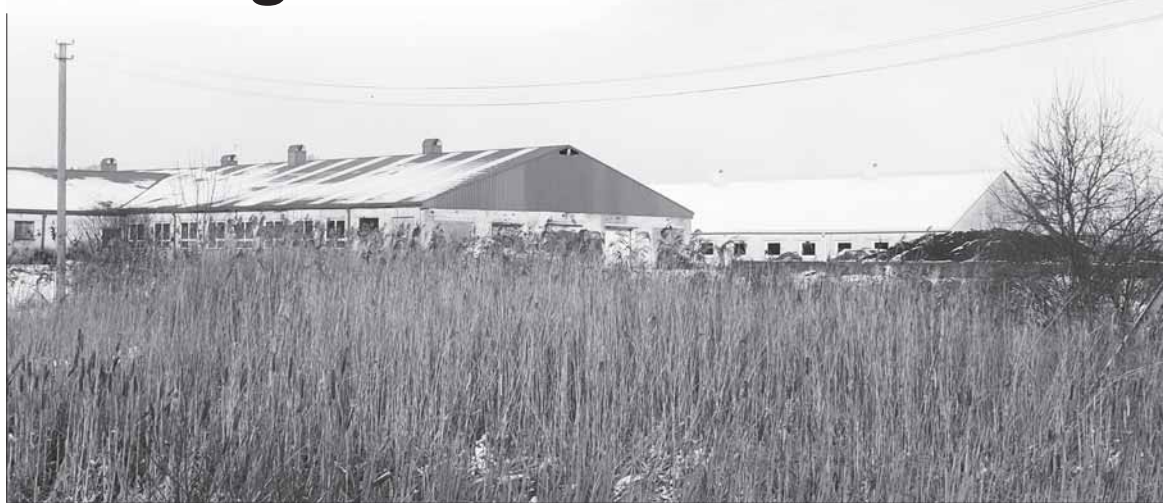
Fermos tuoj bus tuščios.