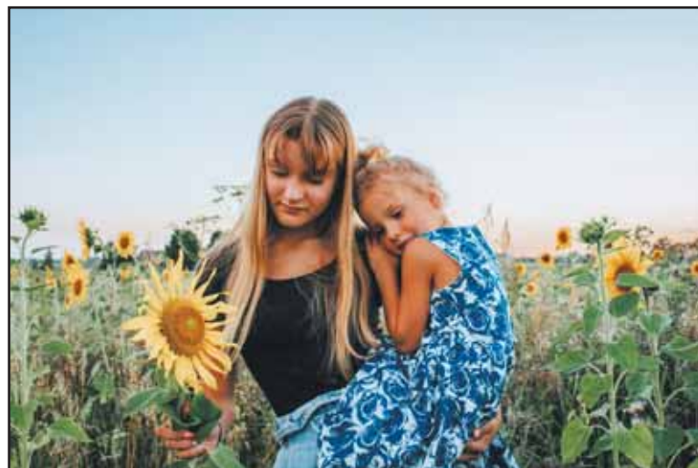
Kadras iš K. Alaburdaitės darytos fotosesijos.

Karolina atvirauja, kad labiausiai mėgsta fotografuoti anksti ryte,