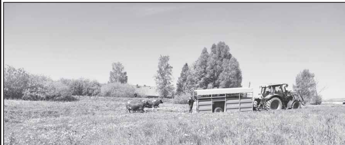
Pienininkystės verslas – perspektyvus, bet tam, kad ši veikla nebūtų varginanti, reikia modernizuoti ūkį. Tam labai praverčia parama.

Ji apdovanota už sėkmingai įgyvendintą projektą, finansuotą pagal Lietuvos kaimo plėtros 2014–2020 m. programos (KPP) priemonės „Ūkio ir verslo plėtra“ veiklos sritį „Parama jaunųjų ūkininkų įsikūrimui“.