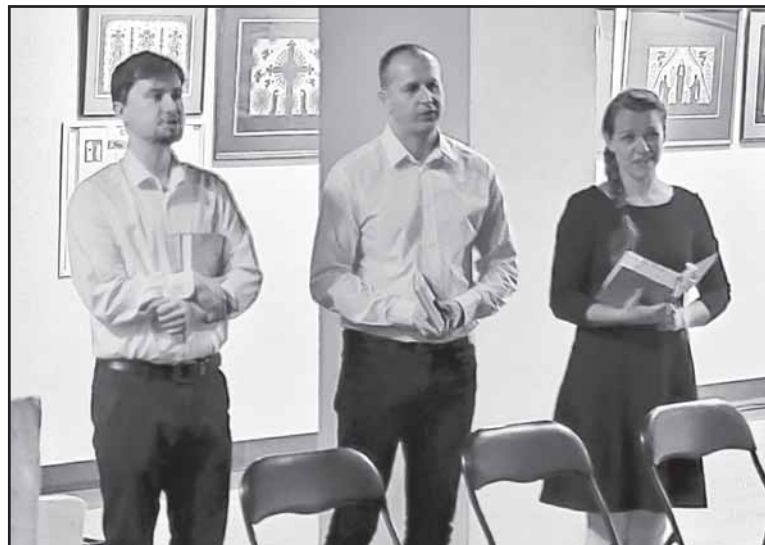
Suvalkų lietuvių teatras „Sūduva“ dovanojo literatūrinį montažą „Vai eičiau, aš eičiau...“