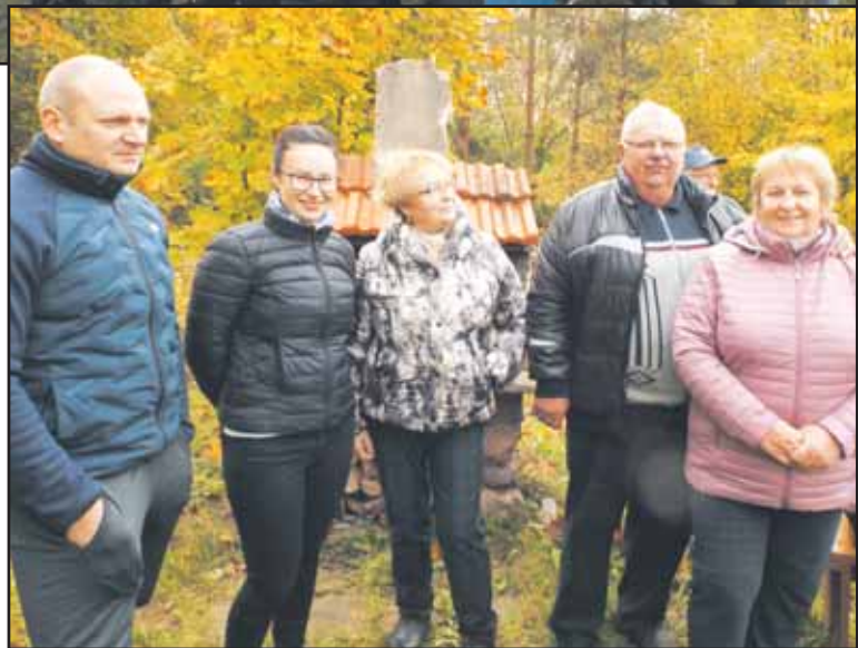
...ir šiandien kuriantys gyvenimą Sobuvoje.