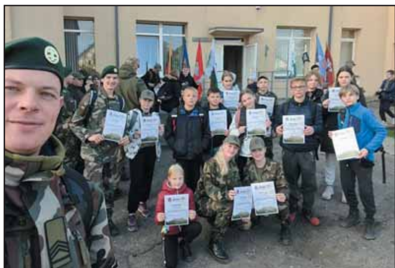
Žygyje gausiai dalyvavo Išlaužo jaunieji šauliai.