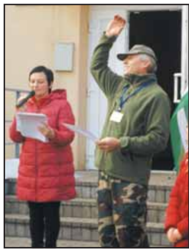
Visiems žygeiviams buvo įteikti raštai, paliudijantys apie dalyvavimą žygyje.