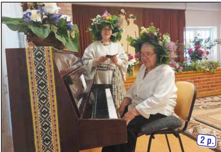
Sveikinimas Pabaltijo šalių Jonams ir Janinoms.