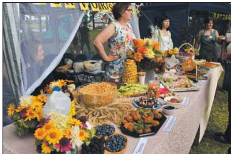
Išradingumu ir vaišingumu kitiems kiemeliams nenusileido „Purvokšnio“ komanda: svečiai buvo vaišinami ir vietoje kepanomis ispaniškomis spurgomis.