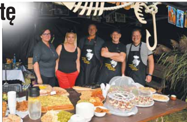
Kiemelio „Kablys“ atstovai ne tik deklaravo, bet ir įrodė, kad virtuvėje jaučiasi kaip žuvys vandenyje.