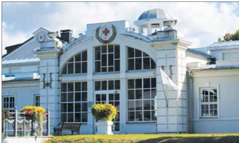
Pirmosios Birštono gydyklos šiemet – 95-eri.