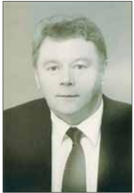
2012 m. JUOZAS PALIONIS (PO MIRTIES) Lietuvos Respublikos Seimo narys, savo darbais ir veikla nusipelnęs Birštono kraštui.