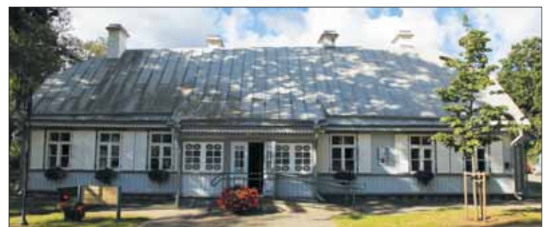
2000 m. įkurtas Birštono sakralinis muziejus buvo pirmasis tokio profilio muziejus Lietuvoje.