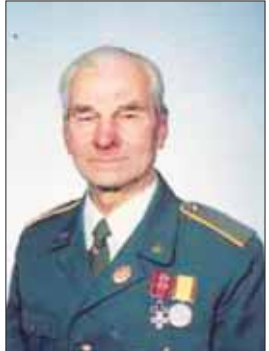
2020 m. POVILAS BUZAS (PO MIRTIES) Buvęs politinis kalinys, „Lietuvos katalikų bažnyčios kronikos“ platiniojas.