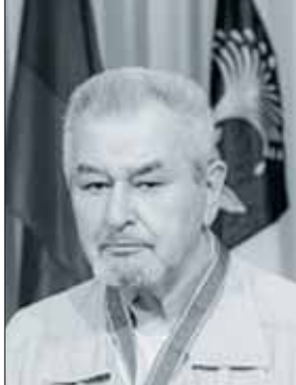
2020 m. STASYS ŽIRGULIS Skulptorius