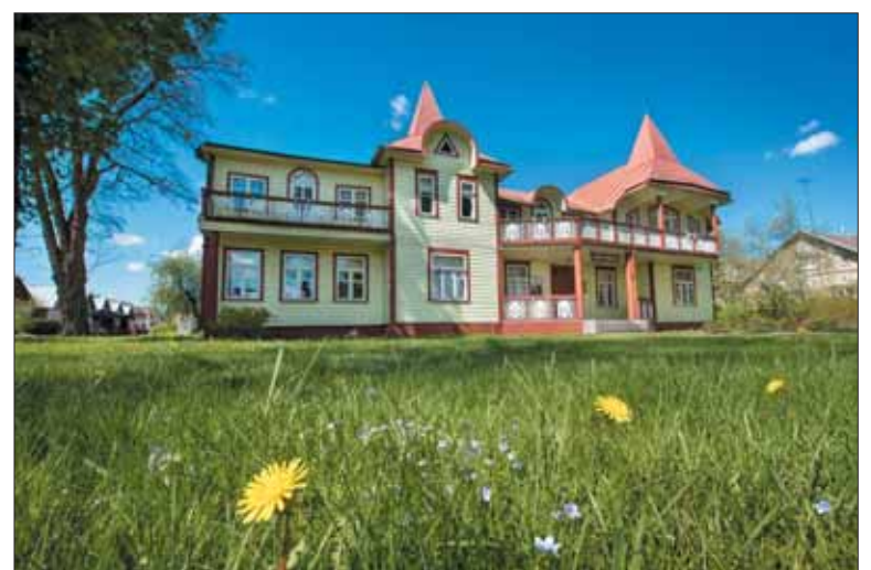
Birštono muziejui šiemet – 55-eri. 1972 m. buvo parengta nuolatinė kurorto ir miesto istoriją atspindinti ekspozicija.