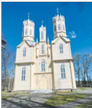
Keliaudami iš Punios, žygeiviai pasiekia Nemajūnus (Birštono sav.), kur siūloma pamatyti Nemajūnų Šv. apaštalo Petro ir Pauliaus bažnyčią.

Atkartodamas Nemuno kilpas, Miško takas suformuoja daugiau kaip 20 km ilgio vingį Nemuno kilpų regioniniame parke, vingiuoda-