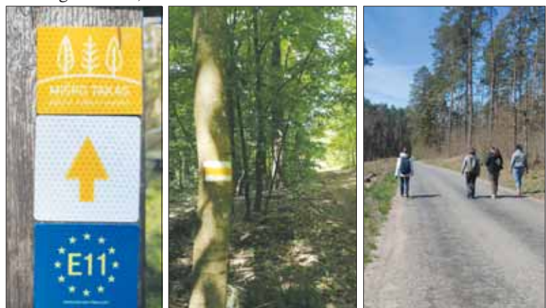
Miško takas mieste ženklina šviesą atspindinčiais lipdukais, gamtoje – baltos, oranžinės, baltos spalvų rodyklėmis.