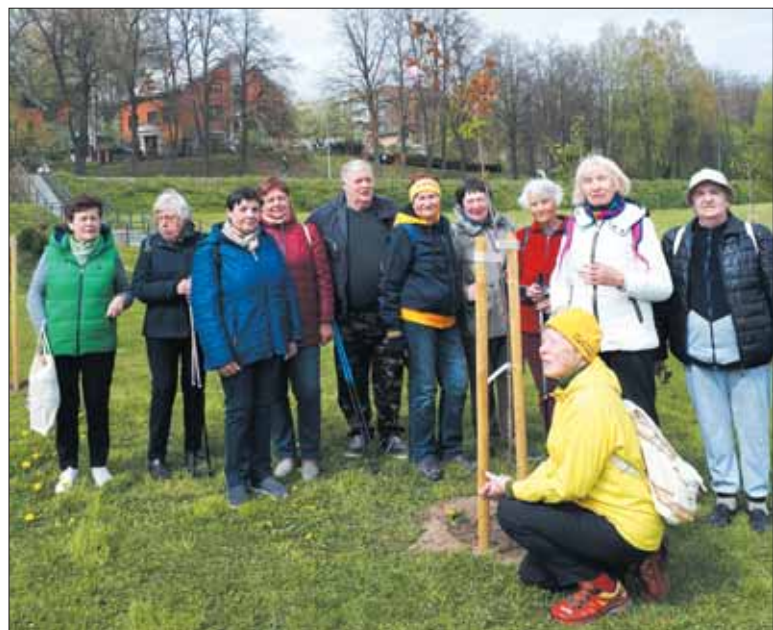
Prie savo sodintos sakuros.

Bet norisi grįžti pora savaičių atgal, kai vienoje Zvėrinčiaus poilsiavietėje smagiai atšventėme Atvelykį. Tai diena, kurią galima skirti susitikimui su draugais, kartu pažaisiti, pasivaikšinti velykiniu pyragu. Bet reikia apie ką nors įdomaus pakalbėti, tad pasirinkome balandį. Tas mėnuo turi įdomių datų, svarbių žemdirbiui šventųjų. Juk pavasario darbuose pagelbėdavo Šv. Izidorius ir Šv. Jurgis, jei gražiai paprašydavai ar net kopytėlė lauko