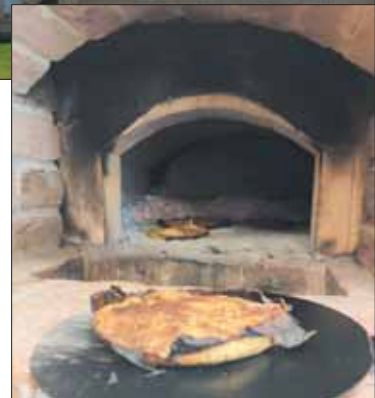
Žygiuojant didesnėmis grupėmis, Panemunio sodyboje galima paragauti dzūkiškų bandų.

Pirmoji žygeiviams draugiška apgyvendinimo įstaiga, kurią pa-