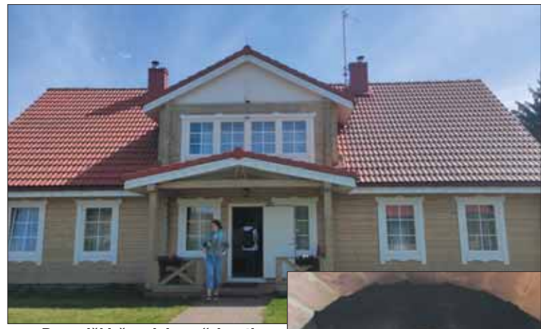
„Draugiški žygeiviams“ įvertinimą gavusi Panemunio sodyba (Birštono sav.).

Iš Birštono takas veda Kauno rajono link, tačiau pirmiausia keliautojai, kirtę Greimų tiltą, pražygiuoja pro centrinę Prienų dalį, kurioje siūloma aplankyti Didžiojo Lietuvos kunigaikščio Kęstučio paminklą, Prienų vandens malūną, Revuonos parką, Prienų krašto muziejų, Prienų Kristaus apsiėškimo bažnyčią, Beržyno parką. Palikus Prienus, pėstieji gali užsukti į paukščių stebėjimo apžvalgos aikštelę, ir truputį atsikvėpus, tęsti kelionę. Keliaudami Kauno