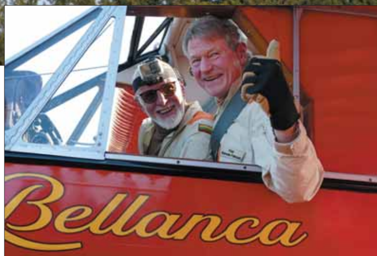
Po skrydžio R. Paksas ir R. Noreika neslėpė šypsenų.

„Smagu pranešti, kad artėja diena, kai į Lietuvos padangę pirmą kartą pakils 1929 m. gamybos lėktuvas Bellanca CH-300 Pacemaker. Tai – vienas iš dviejų tokių lėktuvų visame pasaulyje. 1932 metais tokį pat lėktuvą įsigiję lietuviai pilotai Steponas Darius ir Stasys Girėnas pritaikė jį transatlantiniam skrydžiui ir pavadino Lituanica. 1933 m. liepos 15 d. pakilę iš Čikagos su Lituanica jie perskrido Atlanto vandenyną. Deja, skrydis baigėsi tragiškai: liepos 17 d. lėktuvas nukrito ir sudužo Vokietijoje, iki galutinio tikslo – Kauno – likus 600 km.