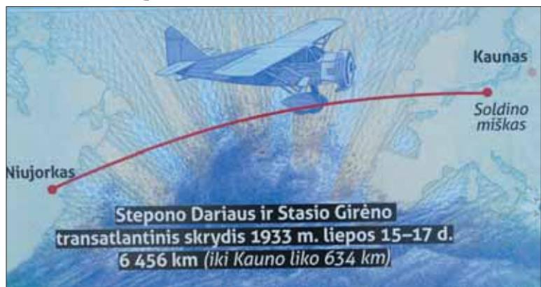
Darius ir Girėno skrydis.

– Lėktuvas labai gležnas ir kol taps Lituanica, reiks gerokai jį sustiprinti, kad pakeltų tris kartus daugiau svorio, nei pats sveria. Devyniasdešimt metų nubėgo į priekį. Šiandien yra kitos aerodinaminės žinios, na-