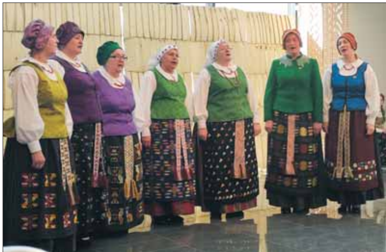
(Atkelta iš 4 p.)

muzikos ir netgi kasdienės duonos su lašinukais.