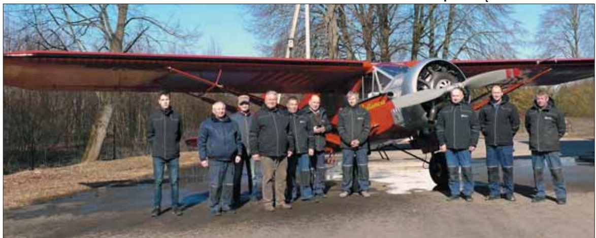
Nuotrauka atminčiai. UAB Termikas darbuotojai prieš išvežant į aerodromą.