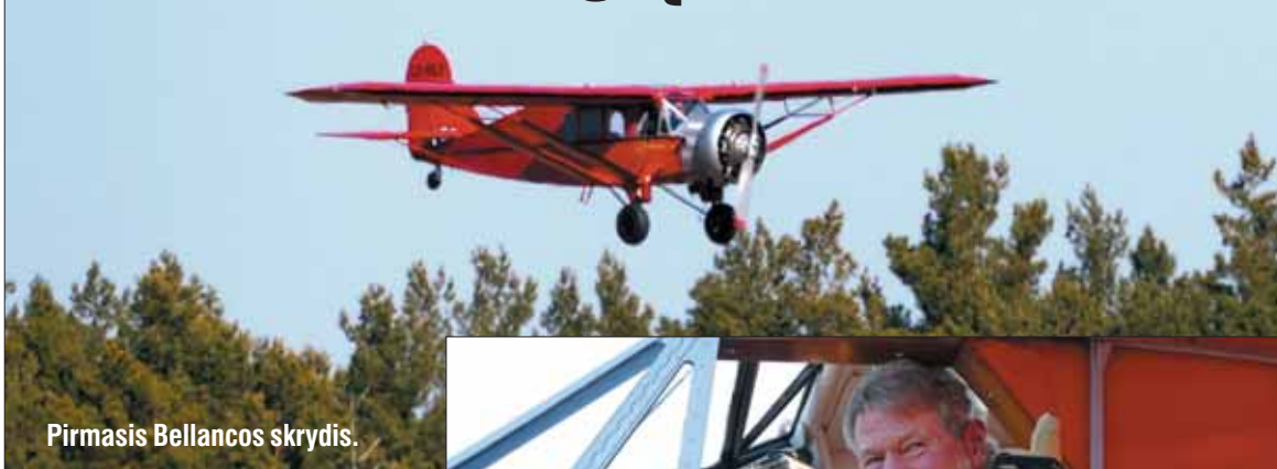
Pirmasis Bellancos skrydis.

„Smagu pranešti, kad artėja diena, kai į Lietuvos padangę pirmą kartą pakils 1929 m. gamybos lėktuvas Bellanca CH-300 Pacemaker. Tai – vienas iš dviejų tokių lėktuvų visame pasaulyje. 1932 metais tokį pat lėktuvą įsigiję lietuviai pilotai Steponas Darius ir Stasys Girėnas pritaikė jį transatlantiniam skrydžiui ir pavadino Lituanica. 1933 m. liepos 15 d. pakilę iš Čikagos su Lituanica jie perskrido Atlanto vandenyną. Deja, skrydis baigėsi tragiškai: liepos 17 d. lėktuvas nukrito ir sudužo Vokietijoje, iki galutinio tikslo – Kauno – likus 600 km.