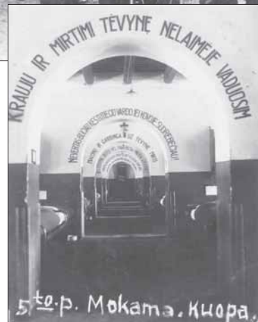
5-to kariuomenės pulko mokomosios kuopos patalpos.