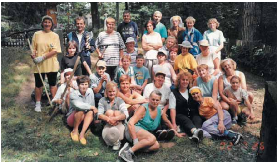
2002 m. vasarą Lietuvos sveikuolių sąjungos stovykla buvo Birštone. Liepos 26 d. stovyklautojai tvarkė Gudakalnio kapinaites.