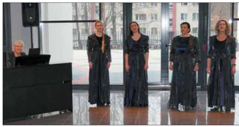
Prienų kultūros ir laisvalaikio centro vokalinė grupė „Aksomas“.