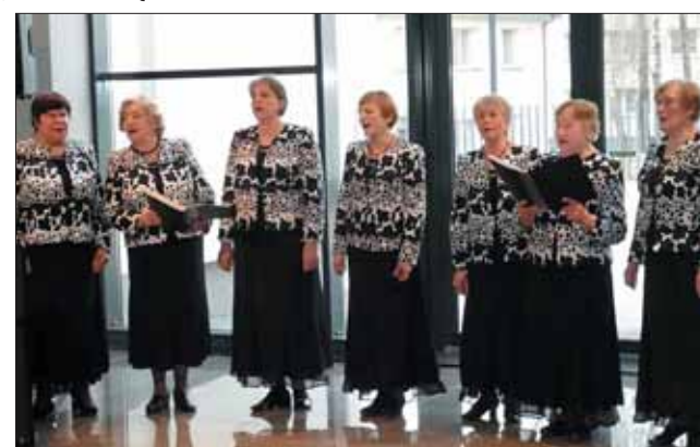
LASS Prienų rajono mišrus vokalinis ansamblis „Puriena“.