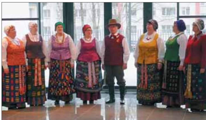
Šilavoto laisvalaikio salės folkloro ansamblis „Akacija“.