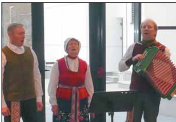
Stakliškių kultūros ir laisvalaikio centro tercetas.