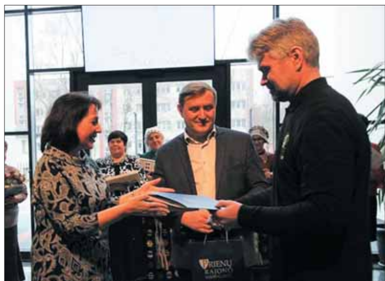
Padėka dailininkui Dainiui Jurevičiui už Prienų logotipo sukūrimą.