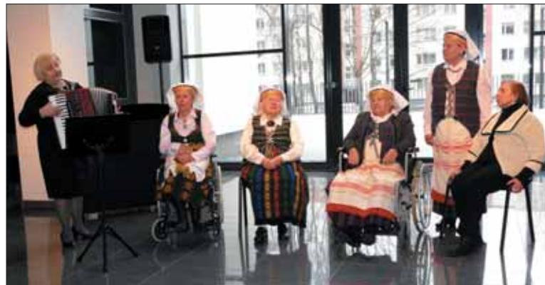
Prienų globos namų folkloro ansamblis „Kvietkelis“.