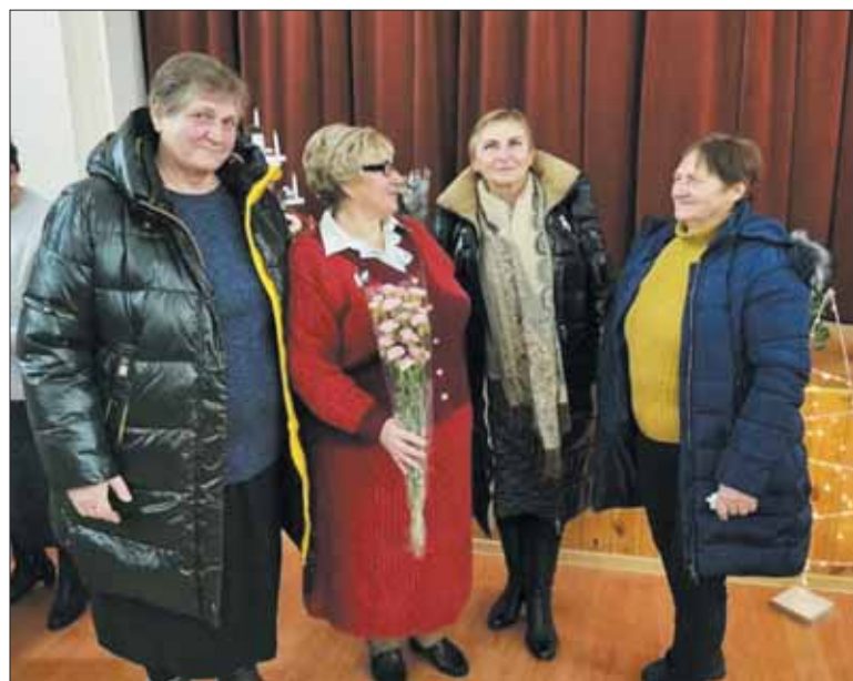
Tarp klasės draugijų.