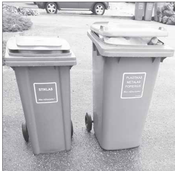
ARATC nuotr. Žiemą konteinerių išvežimo grafiką „pakoreguoja“ ir oro sąlygos.

Nuo įvairių netikėtų situacijų ir gamtos išdaigų niekas nėra apsaugotas, tačiau ARATC patikina, jog neištuštintas konteineris anaipol nereiškia, kad jis pamirštas. Tiesiog kartais reikia kantrybės ir supratingumo – juk atliekas surenka ir jas veža žmonės, kurie, dirbdami savo darbą, taip pat nori jaustis saugūs, nerizikuoti važiuoti slidžiais, nepabarstytais žiemos keliais.