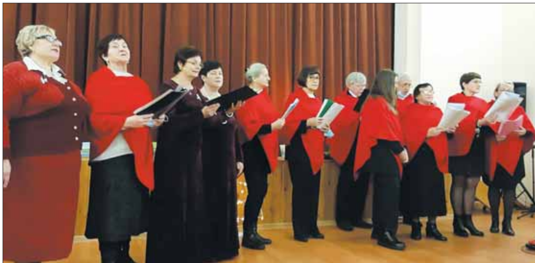
Veiverių šv. Liudviko parapijos bažnyčios choras.

...Šventė baigėsi. Šilti prisiminimai iškeliavo į Šakius, Kazlų Rūdą, Alytų, Kauną. Apsigyveno daugelio šio gražaus renginio dalyvių ir veiveriečių atmintyje.