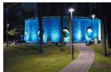
Minint Pasaulinę diabeto dieną, Birštono mineralinio vandens garinimo bokštas apšviečiamas mėlyna spalva.