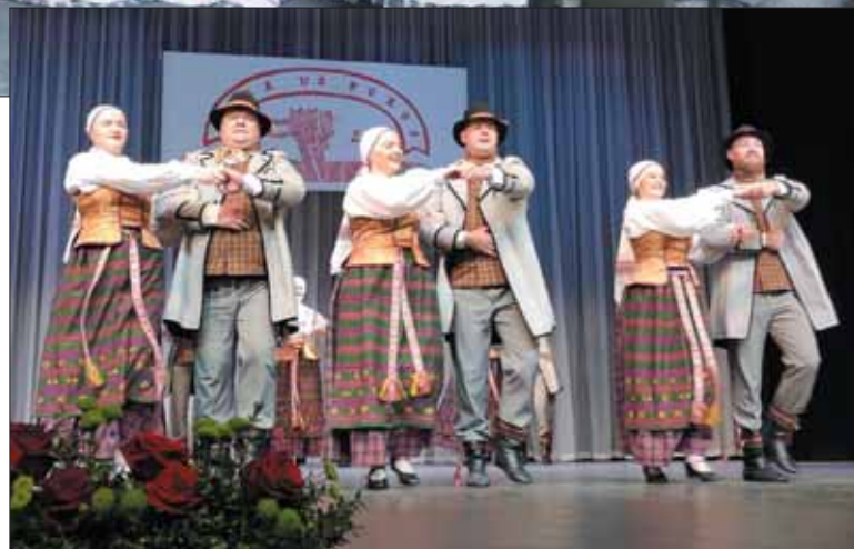
Seinų „Lietuvių namų“ kolektyvas „Seina“.

Paklausta, kaip į kolektyvo veiklą sekasi pritraukti jaunimą, D. Astrauskienė atsakė: „Su jaunimu yra kita problema – Seinų „Žiburio“