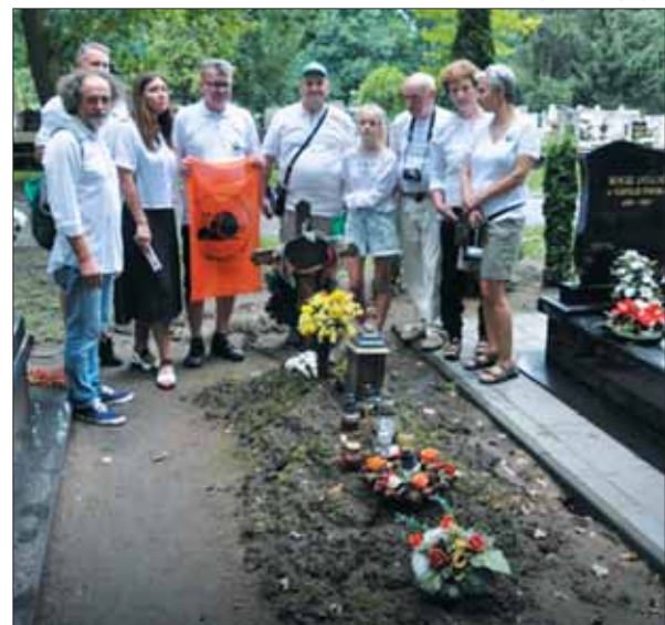
Ant P. Normanto kapo Nyredhazos kapinėse išbarsytos žemės smiltys, atvežtos iš Papilės kapinių.