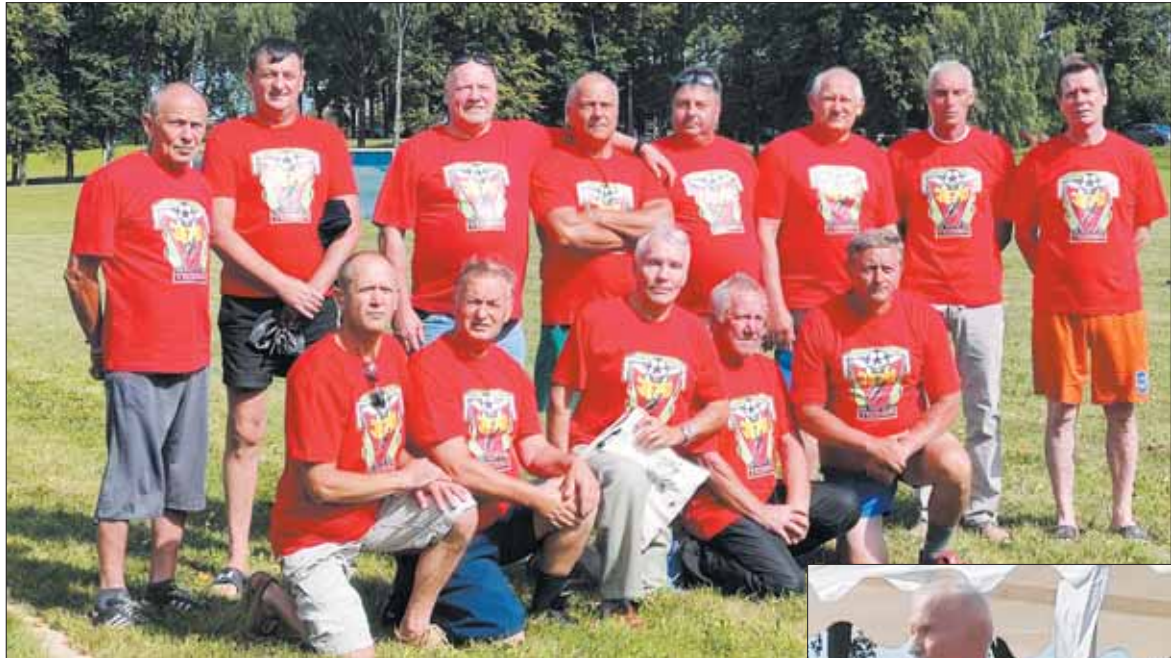
Jiezno futbolo turnyras turi galias tradicijas, siekiančias garsios „Jiezno technikos“ (dabar „Veteranų“) komandos šlovingus laikus.

Kiekvienas Jiezno krašto gyventojas ar buvęs jieznietis žino, kad paskutiniojo liepos savaitgalio praleisti nevalia, mat jau keletą dešimtmečių Jiezne vyksta tradicinės Jiezno futbolo važybos, suburiančios Jiezno apylinkių sporto bendruomenę, buvusius bei esamus šio krašto gyventojus ir miesto svečius. Šie metai – ne išimtis, juo labiau, kad liepos 31 d. Jiezno futbolo stadione įvyko jubiliejinė 30-oji futbolo šventė.