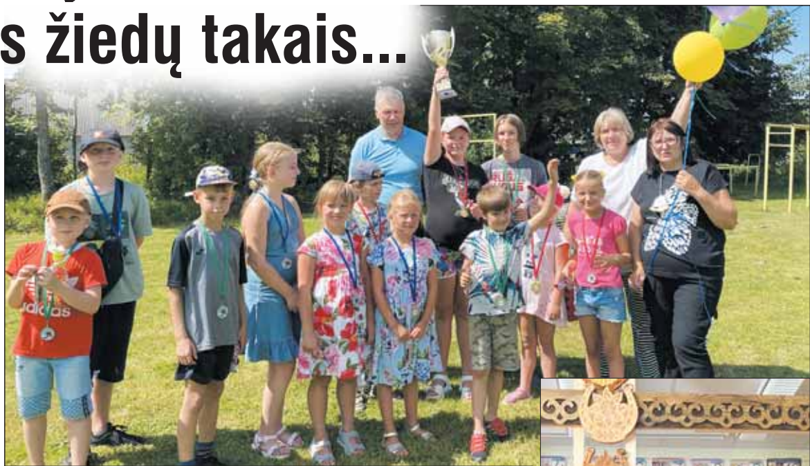
Estafečių apdovanojimų akimirka.