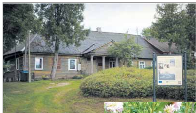
Nors šiemet pavasaris vėlavo, bet Ustronėje (Jundeliškėse) buvusio dvarelio šeimininko gimtadieny jurginai, kaip visada, spėjo pražysti.