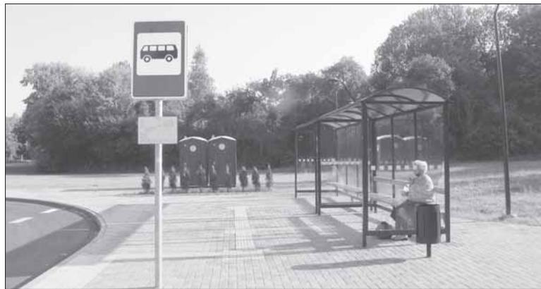
Jiezniškiai ir aplinkinių vietovių gyventojai džiaugiasi naujai sutvarkyta stoties aplinka, bet pasigenda į ją užsakančių autobusų.

Pagal Prienu autobusų stoties informaciją, šiuo metu Jiezno miestą iš Prienu galima pasiekti trimis maršrutais. Autobusas į Vilnių kursuoja šešis kartus per dieną, pradedant 7 val. ryto, baigiant 19 val.