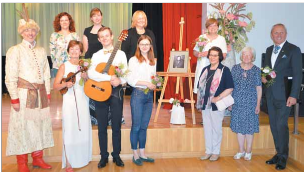
Vakaro dalyviai ir organizatoriai.