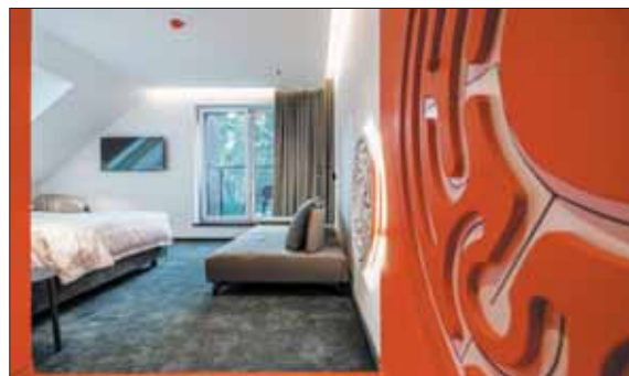
„Esė“ viešbutyje kambarį galima pasirinkti ir pagal temą.