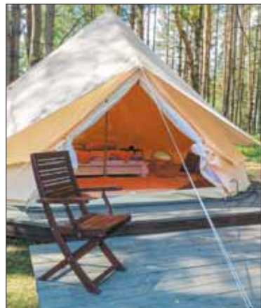
Kempinge turistai gali įsikurti ir dvivietėse „Glamping“ palapinėse.

Birštono gyventojus ir svečius džiugina ir naujos maitinimo vietos. Birštono kultūros centre duris atvėrė „Namuų restoraną“. Čia lankytojų lauks išskirtinis vidaus interjeras, jaukus kiemelis ir erdvi stogo terasa. Restorane galima paskanauti modernios pasaulio virtuvės patiekalų, kurie ruošiami iš sezoninių, vietinių ūkininkų tiekiamų daržovių, vaisių, mėsos ir žuvies. „Namuų restorane“ laukiami ir vaikai, kuriems įrengtas žaidimų kampeilis, ir augintiniai. Norinčius greitai pavalgyti kviečia naujas bistro „Seklytėlė“. Šalia jau gerai pažįstamos Birštono „Seklytėlės“ įsikūręs bistro lankytojus trauks stogo terasa – regykla, nuo kurios atsiveria pasakiškas vaizdas į Nemuną.