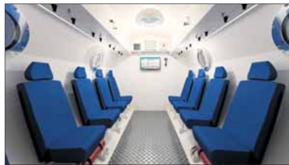
„Vytautas Oxygen SPA“ veikia pirmoji Baltijos šalyse daugiavietė hiperbarinė oksigenacijos kamera.