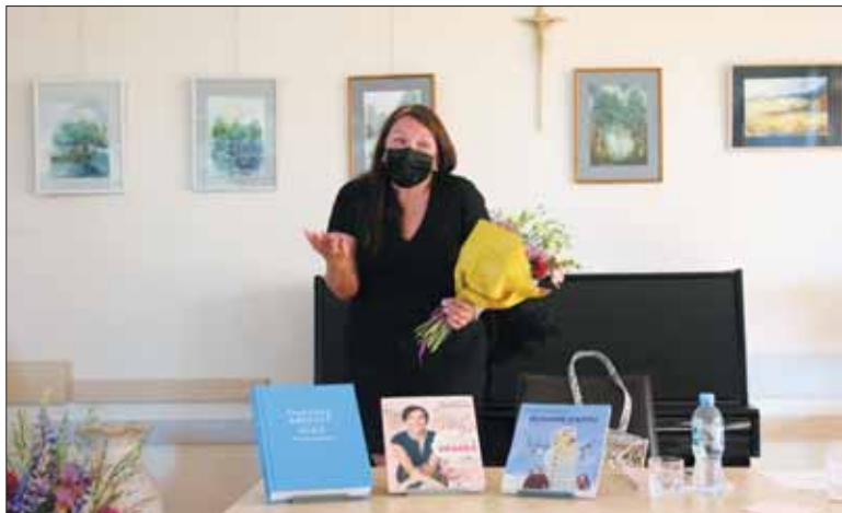
(Atkelta iš 5 p.)

vieną mitą, kuris sklaido visuomenėje. Vienas įdomiausių ir aktualesnių šiuo metu absolventams – apie tai, kokią įtaką jaunuolio sėkmei daro universiteto prestižas. Visi žino Harvardo universitetą. Įsivaizduojama, kad jį baigusiam žmogui sėkmė garantuota. Deja, tyrimai rodo ką kita. Tik 16 proc. Harvardo absolventų yra sėkmingi ir daug uždirba. Visi kiti nesiskiria nuo kitų universitetų absolventų. Taip yra todėl, kad tie 16 procentų jau studijai turėjo gyvenimo tikslą ir viziją, o ne tikėjosi, kad universitetas jiems suteiks tikslą ir kryptį gyvenime. Jie norėjo kurti ir atrasti, jiems reikėjo žinių svajonių įgyvendinimui, o ne tiesiog įstoti į prestižinį universitetą. Dėl šios priežasties yra žymiai svarbiau mokyti vaikus išsikelti tikslus, spręsti problemas, analizuoti, apibendrinti, komunikuoti ir kitų vadinamųjų minkštųjų gebėjimų.