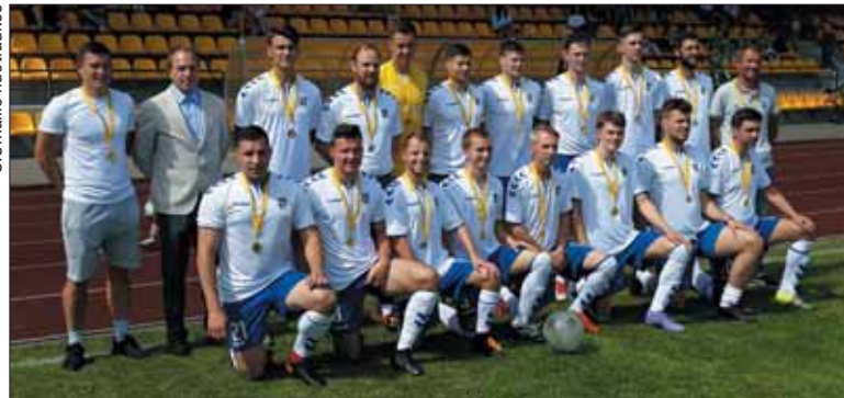
Vyru futbolo komanda „Nemunas“.

Po to stadione buvo sužaistos LFF III lygos Kauno apskrities futbolo pirmenybių rungtynės tarp