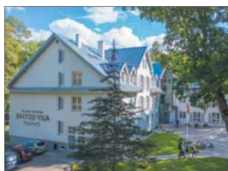
Seniausia kurorto sanatorija gyvavimo trukmę skaičiuoja ne metais, o turiniu, t.y. kokią pridėtinę vertę Žmogui ji sukūrė.

Reikšmingos šventės proga „Tulpės“ sanatorijos darbuotojai kartu su besigydančiais