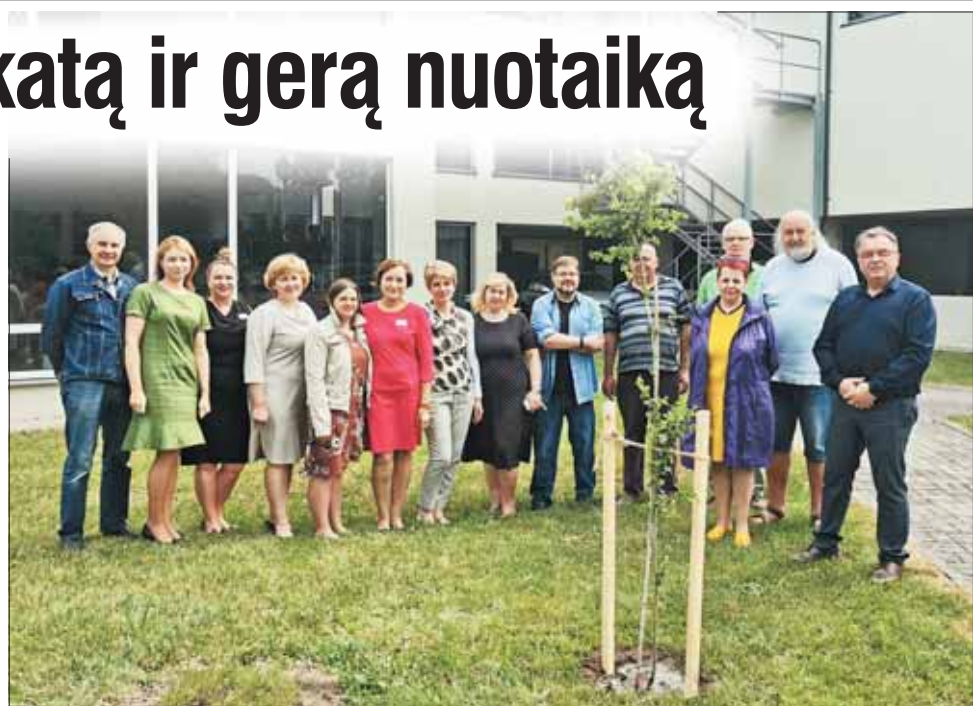
Nuo šiol atvykusius į „Tulpės“ sanatoriją sveikins sveikatą ir gerą nuotaiką simbolizuojančios, sanatorijos darbuotojų pasodintos gudobelės.

pacientais prisijungė prie organizuojamos akcijos pasodindami dekoratyvinius medelius – gudobėles – šalia sanatorijos gydyklos. Šie medeliai simbolizuoja sveikatą ir gerą nuotaiką.