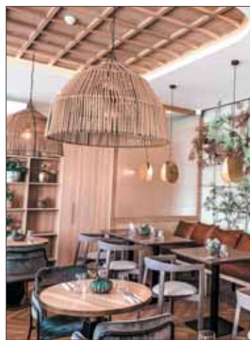
„Namuų restoraną“ įsikūrė Birštono kultūros centro erdvėje.

Kempingas „Natur Camp Birštonas“ plėsdamas savo veiklą šį sezoną pristato septynis naujus keturviečius „Pušyno namelius“ su visais patogumais bei šešias prabangaus stovyklavimo dvivietes „Glamping“ palapines, kurių privalumas – miegas patogioje lovoje gamtos apsuptyje.