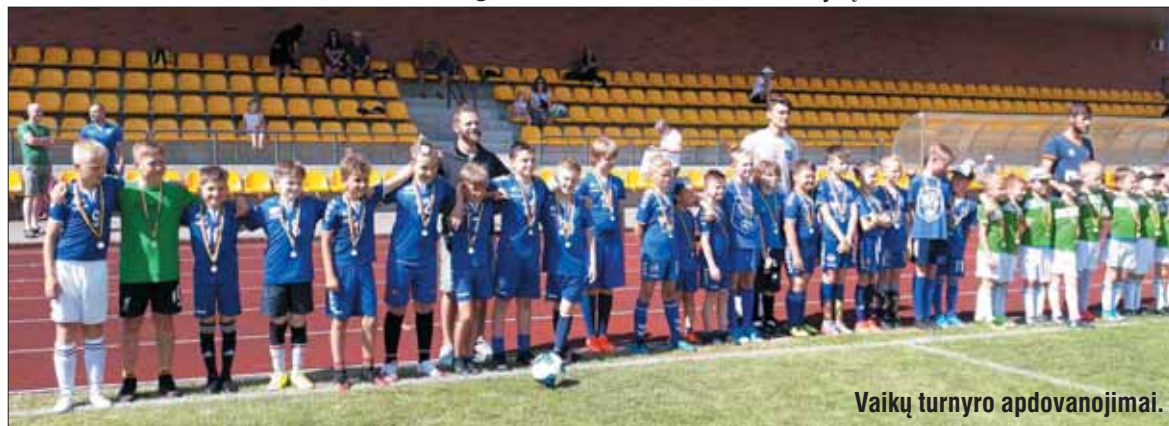
Vaikų turnyro apdovanojimai.

Stadione futbolas karaliavo ir toliau – ištikimiausi sirgaliai galėjo stebėti moterų komandų iš Estijos ir Farerų salų treniruotes prieš Lietuvoje surengtą Baltijos taurės turnyrą.