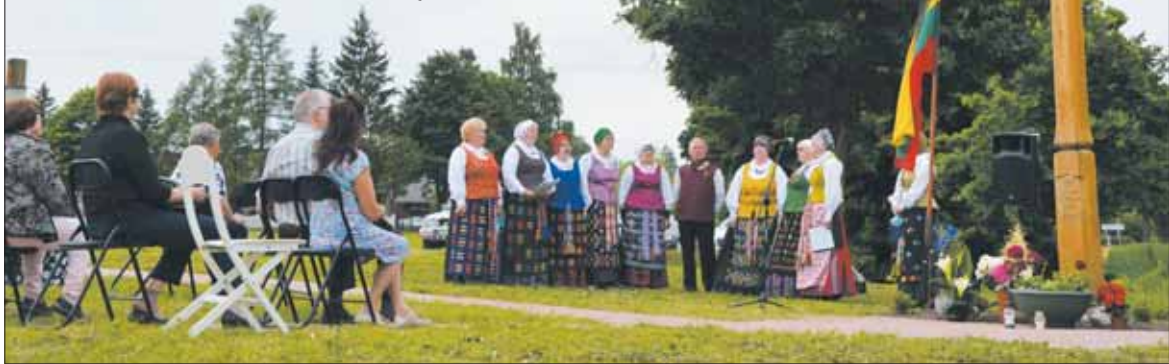
Prie įvažiavimo į Šilavoto miestelį atstatytas ir pašventintas kopyltstulpis tremtinių atminimui.