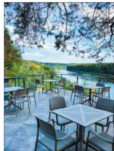
Norinčius greitai pavalgyti kviečia naujas bistro „Seklytėlė“.

Prie Nemuno įsikūręs viešbutis „Royal SPA Residence Birštonas“ netrukus lankytojus nustebins nauju baseinu ir SPA centru bei atnaujintais viešbučio kambariais. Erdvus baseinas su vaizdu į mišką iškurs naujai statomame atskirame pastate, o dabartinėse baseino patalpose veiks modernus SPA centras, talpinsiantis 25 procedūrų kabinetus, vonias.