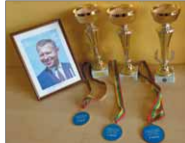
Prizai laukia nugalėtojų.

Varžybų dalyvius sveikino, dėkojo ir prizus įteikė Aleksandro Jo-