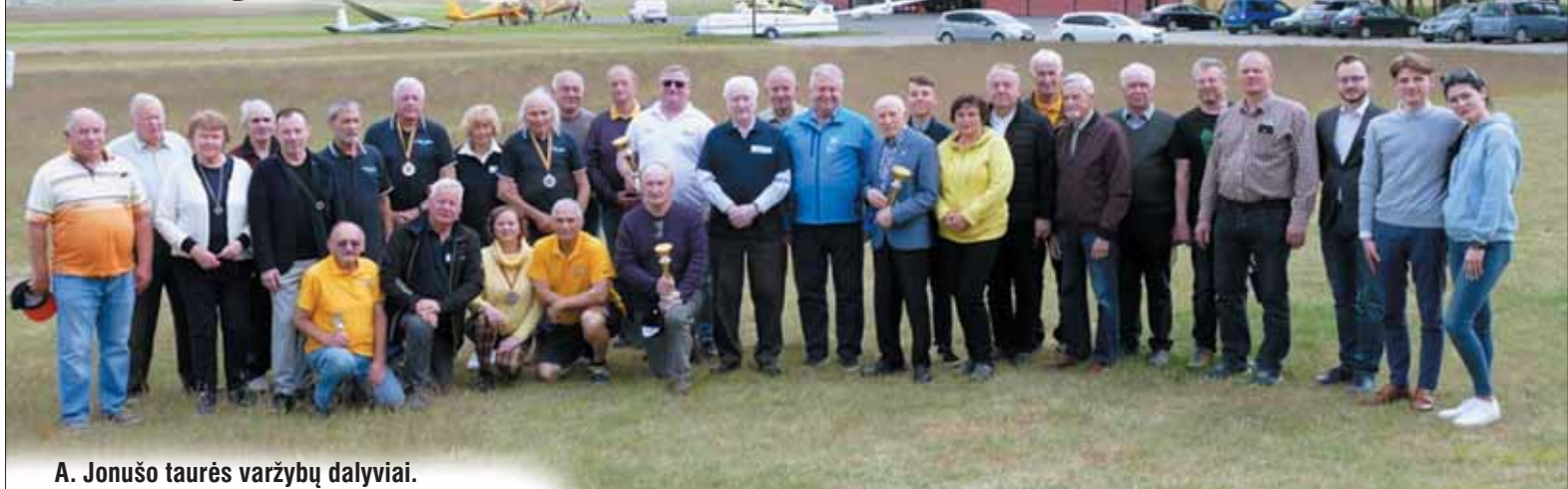
A. Jonušo taurės varžybų dalyviai.

Praėjusį šeštadienį Pociūnuose vykusios Lietuvos aviacijos veteranų sąjungos (LAVS) konferencijos dalyviai išsiskyrė neilgam – po trijų dienų vėl sulėkė į sklandymo Meka vadinamą aerodromą. Šįkart – pasivaržyti dėl Aleksandro Jonušo taurės.