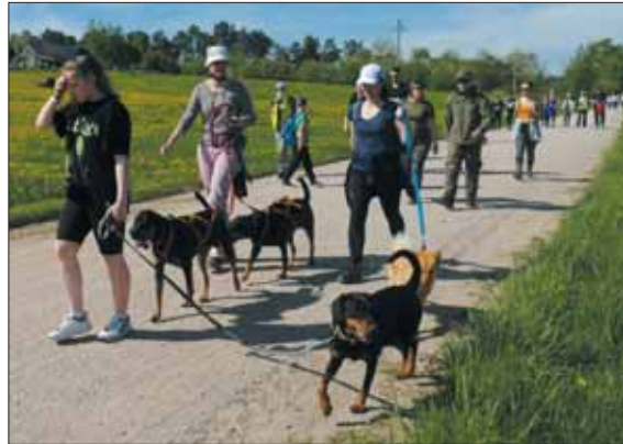
Žygyje keliavo ir Lietuvos skalikai.