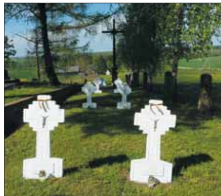
Partizanų kapai Šilavote.