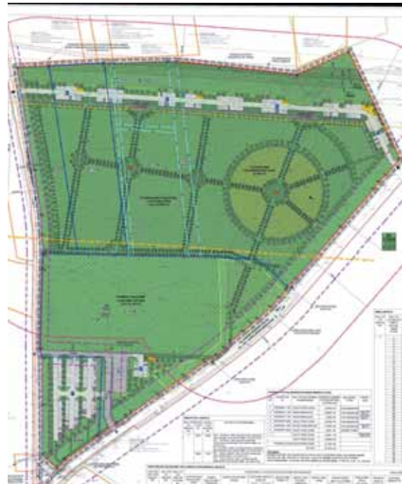
Nemajūnų kapinių detaliojo plano brėžinys.