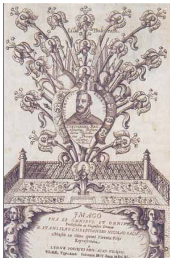
Pacų geneologinis medis, centre – Steponas Pacas. 1640 m.

Iškili, didinga barokinė bažnyčia Pacų laikais buvo nuolat puošiamą, atnaujinama. Nauju išorės rūbu ji rengiasi ir šiuo metu. O buvusio dvaro palikimo ženkl-