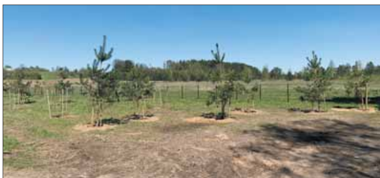
Aptverta ir apželdinta Nemajūnų kapinių teritorija.

Projektas finansuojamas iš Lietuvos kaimo plėtros 2014–2020 metų programos lėšų, jo vertė – 83 394,05 Eur, iš jų – 66 710 Eur sudaro ES lėšos, likusi 20 proc. suma – Savivaldybės bendrojo finansavimo lėšos. Jį įgyvendina Birštono savivaldybės administracija kartu su Alytaus rajono vietos veiklos grupe, partnerė – Ne-