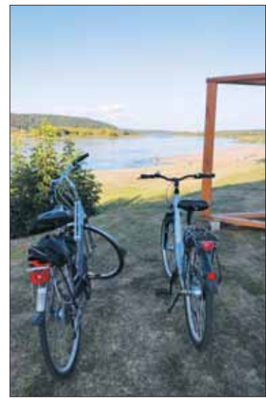
Pasigrožėti vaizdingomis panoramomis Kauno rajonas siūlo ir pėsčiomis, ir dviračiais, ir laivais.

Keliauti ekologiškai kviečia ir Trakai , siūlantys net 60 maršrutų gamtą tausojančiomis priemonėmis: dviračiu, elektriniais paspirtukais ir traukiniais, irklentėmis, mintlentėmis, saulės baterija varomais laiveliais, pramoginiais laivais, barbekiu plaustu, jachtomis, vandens dviračiais, baidarėmis, pėsčiomis