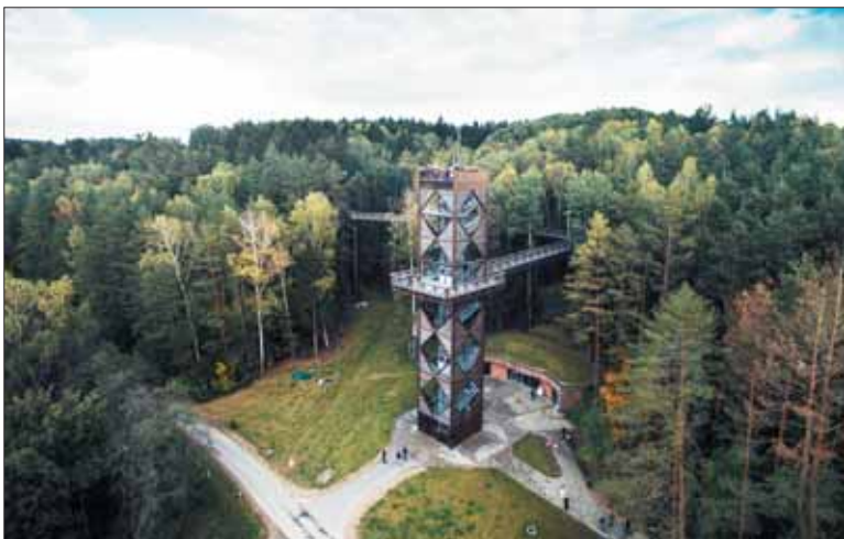
Anykščiai šiame turistus pakvies išbandyti naujas ir laiko patikrintas pramogas.