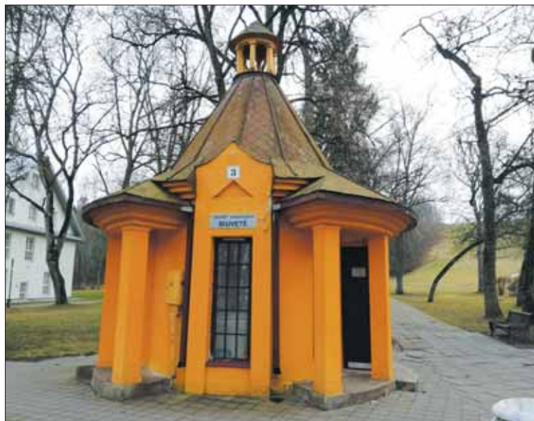
Seniausią Lietuvos kurortą puošia Antrąjį pasaulinį karą atlaikiusi biuvetė, kviečianti miesto svečius atsigaivinti mineraliniu vandeniu.