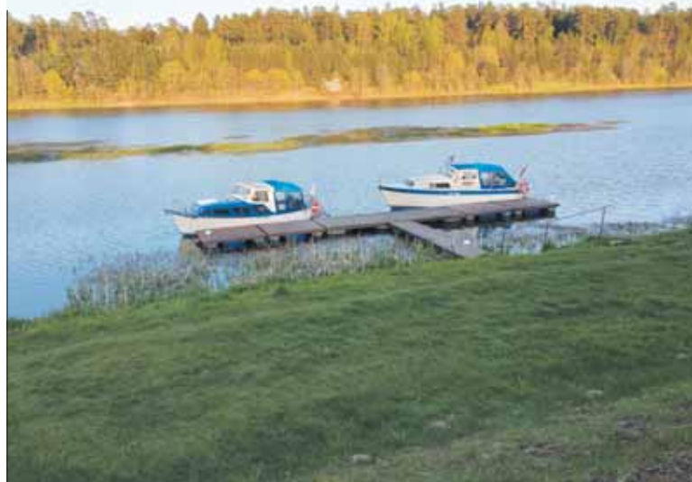
Birštonas jau ruošiasi ir laivybos sezonui.