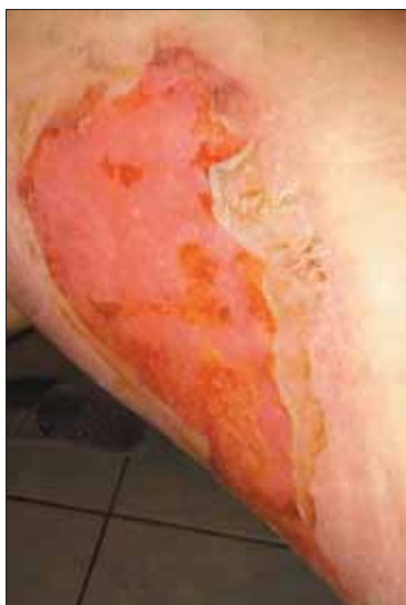
3 pav. Nudegimas karšta arbata.

Esant rimtam, trečio laipsnio, nudegimui žaizda turi būti apžiūrėta ir įvertinta gydytojo. Pačiam žmogui paprastai gali būti sunku įvertinti nudegimo rimtumą, todėl, jei yra nudegęs didelis odos plotas, pažeisti gilesni audiniai, apdegė veido, kaklo, plaštakų, tarpvietės, padų sritys, reikėtų nedelsiant kreiptis į gydytojus.