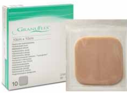
Hidrokoloidinis tvarstis GranuFlex – sausoms, negausiai šlapiojančioms žaizdoms.