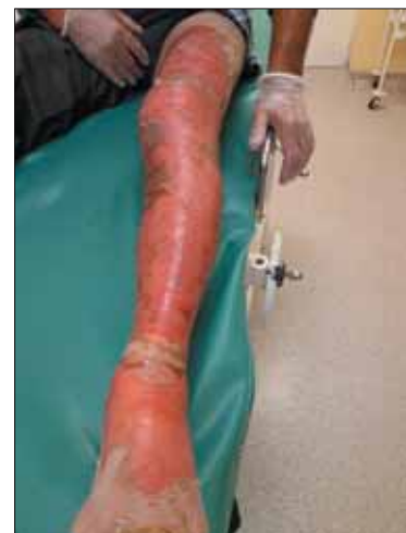
1 pav. Nudegimas su ant lauzo virtu troškiniu.