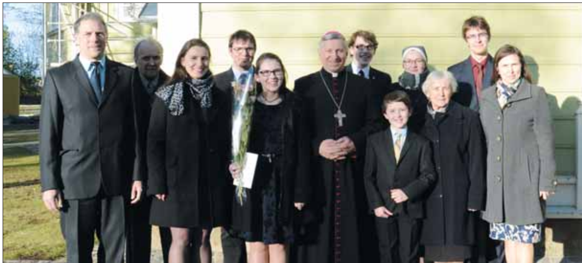
Stravinskų šeima su vyskupu JE Rimantu Norvilu.