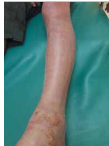
2 pav. Nudegimas sugydytas GranuFlex tvarščiu per 1 mėn.

kelias paras, o esant itin palankiam gijimui, gali būti laikomas iki savaitės. GranuFlex, GranuFlex Extra Thin (ypač plonas) ir AQUACEL Ag+ Extra tvarščius priskiriu pirmos pagalbos tvarščiu, kurie turėtų būti kiekvieno mūsų namų vaistinėje.