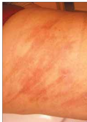
4 pav. Nudegimas sugydytas GranuFlex tvarščiu per 7d.