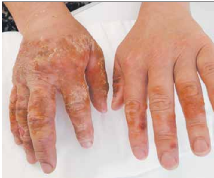
5 pav. Nudegimas rūtų išskiriamomis sultimis.

Informacija pateikta remiantis „Europos nudegimų asociacijos“ rekomendacijomis („The European Burns Association“).