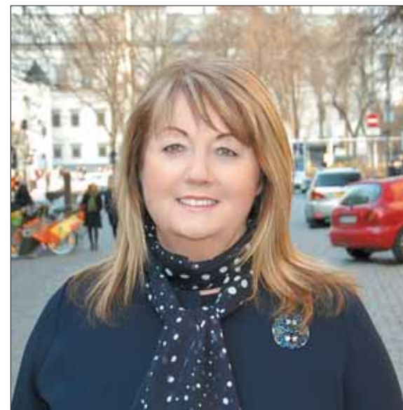
Vilija Blinkevičiūtė: „Kai kurios karantino priemonės buvo perteklinės.“

ES valstybėms narėms bus suteikta teisė pačioms spręsti, kaip įgyvendinti Vaiko garantijų sistemą.