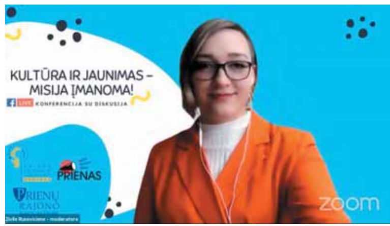
Konferenciją „Jaunimas ir kultūra – misija įmanoma!“ organizavo Prienų kultūros ir laisvalaikio centre veikianti atvira jaunimo erdvė „Prienas“.

„Marijampolė iš esmės – tai tipinis postsovietinis miestas su aikšte ir viešbučiu. Mes neturime kokio nors ypatingo turistų traukos objekto ar išskirtinės gamtos, tačiau mes ne-