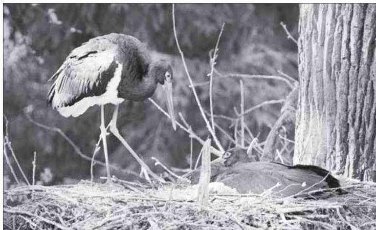
Naujajame miško sklype gali apsigyventi juodieji gandrai.

„Sengirės fondas“ įsteigtas po filmo „Sengirė“ premjeros Lietuvoje, kuri įvyko 2018 m. kovą, tarptautinio „Kino pavasario“ festivalio metu. Daugybę nacionalinių bei tarptautinių apdovanojimų pelnęs dokumentinis filmas Lietuvoje pritraukė rekordinį 67 tūkstančių žiūrovų skaičių, buvo apdovanotas dvejomis „Sidabrinėmis gervėmis“, rodomas 30 valstybių ir 50 su viršum tarptautinių festivalių. Pusė seansuose surinktų lėšų skirta „Sengirės fondui“ – išsaugoti dokumentikoje pristatytas senąsias Lietuvos girias kaip prieglobstį nykstančioms gyvūnų ir augalų rūšims.