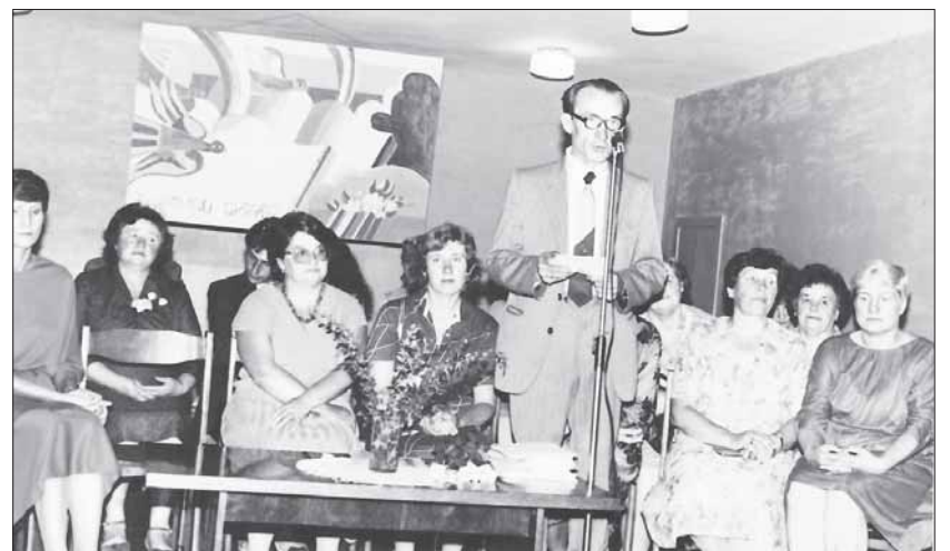
A. Micka ir „Revuonos“ mokyklos mokytojų kolektyvas, sveikinant 10 laidos abiturientus.

riumi. 1957 m. sugrįžo į Prienus. Dirbo Pakuonio vidurinės mokyklos direktoriumi, Švietimo skyriaus inspektoriumi. Visą laiką kritiškai vertino švietimo sistemą, bandė daug ką pakeisti ir dirbdamas Švietimo skyriaus vedėju užtardavo kompartijos persekiojamus mokytojus. Nuo 1979 m. beveik iki mirties 1994 m. dirbo Prienujų II vidurinės mokyklos direktoriumi. Direktoriaudamas svarbiausią dėmesį skyrė ugdymo turiniui patiemis mokytojams ir mokiniams.