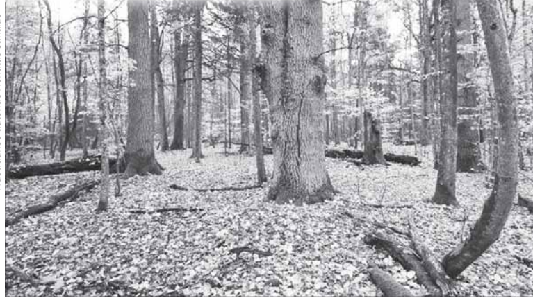
Naujasis „Sengirės fondo“ įsigytas miško sklypas.

„Naujame sklype yra ir „sauto“, ir užlieto miško – tai didžiulis privalumas, nes keičiantis klimatui tai leis miškui iškeisti įvairius svyravimus, – sakė dr. Ž. Preikša. – Sklype taip pat gausu ažuolų, kuriems 140–160 metų, senų drebulių. Galingos šakos, laisvai galinčios atlaikyti ir erelių, ir juodųjų gandrų lizdus. Taip pat pavyko surasti raudonosios knygos atstovą ažuolinį skaptuką ir dar keletą „kertinių“ (sengirių) rūšių. Sklype aptiktos bent 7 medžių rūšys, o tai parodo gerą potencialą