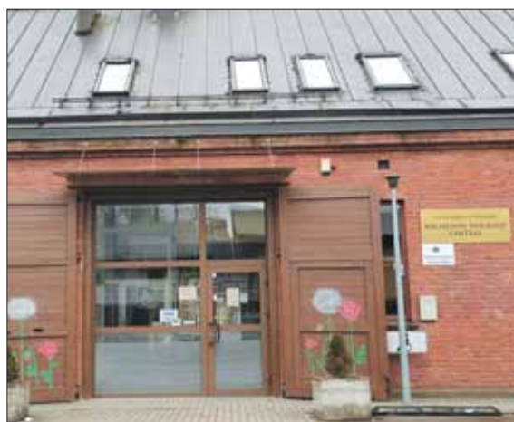
Buvęs ginklų sandėlis – dabar Prienų socialinių paslaugų centras.