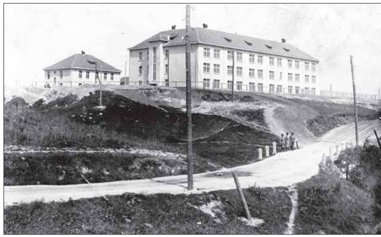
Prienų kareivinės tarpukariu.