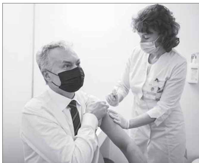
Prezidentas skiepiasi nuo COVID-19 „AstraZenecos“ vakcina.

d. ir kovo 22 d. ryto duomenimis, per praėjusias dvi paras Prienų r. savivaldybės teritorijoje nenustatytas nė vienas naujas susirgimo COVID-19 liga atvejis. Šiuo metu Prienų rajone serga 36 asmenys, deklaruotas sergančiųjų skaičius – 458, statistiškai pasveiko 1822 gyventojai, deklaruota – 1400 pasveikusiuju.