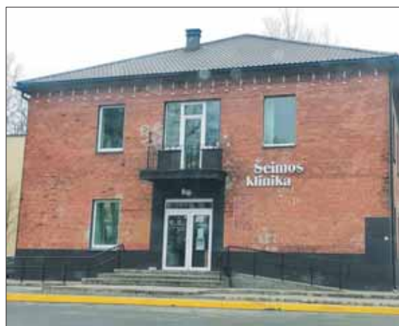
Buvusiame komendantūros administraciniame pastate dabar įsikūrusi „Vitasimplex“ klinika.