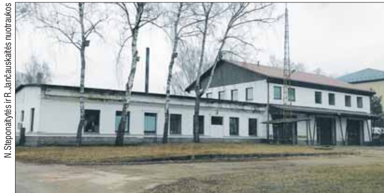
Šiaurinėje karinio miestelio dalyje, viename iš buvusių ūkinių pastatų įsikūrusi Prienų priešgaisrinė gelbėjimo tarnyba.

Pasak paveldosaugininkės, priešingai nei cariniu laikotarpiu, Lietuvos kariuomenės igulų įsikūrimas miestuose ir miesteliuose turėjo didelę reikšmę lietuvių kultūros sklaidai ir stiprinimui – jų teritorijose buvo klubai, kino salės, skaityklos, vykdavo bendri kariuomenės ir visuomenės susitikimai, teatrų spektakliai, koncertai, kuriuose galėjo lankytis ir gyventojai. Mažuose mieste-