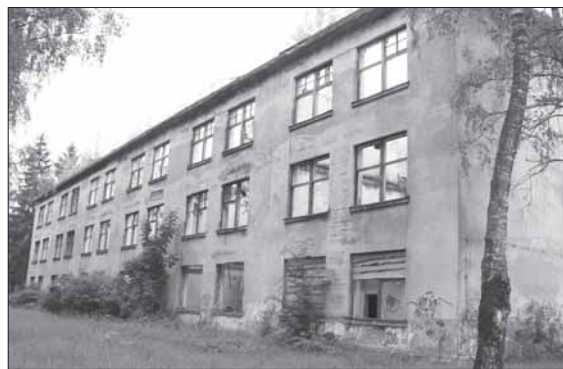
1-asis ir 2-asis kareivinių pastatai 2012 m. Antrojo, raudonų plytų pastato durų ir kai kurių langų angas puošia originalūs platus, balti dazyti apvadai ir puošybos elementai. Tai kone vieninteliai išlikę Prienų kareivinių puošybos elementai.

Per dešimtmetį (1930–1940 m.) Lietuvoje iš viso pastatyta devyni kariniai miesteliai. 1935 m., greta Prienų dislokavus 5-tąjį Lietuvos Didžiojo Kunigaikščio Kęstučio pėstininkų pulką ir tris artilerijos divi-