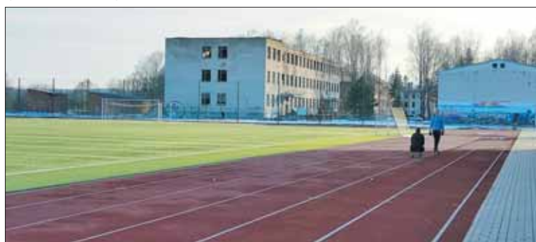
Didelę reikšmę Lietuvos sporto vystymuisi turėjo ir kariniuose miesteliuose įrengti sporto stadionai. Toks stadionas atsirado ir Prienuose. Prieš keletą metų atnaujintas, dabar sporto aikštynas tenkina miesto sporto entuziastų poreikius.

liuose kariuomenės igulos dažnai tapdavo vieninteliais kultūros židiniais, jose buvo salės, bibliotekos. Neraštingi ar mažaraščiai kaimo vaikinai kariuomenėje turėjo galimybę lavintis, įgyti higienos igūdžių (tai liudija tarpukario kariškių spauda), turėjo galimybę skaityti tuometinę spaudą. Didelę reikšmę kariuomenės igulos turėjo ir Lietuvos sporto vystymuisi, igulų teritorijose įkurti pirmieji Lietuvos stadionai, atitinkantys naujausius reikalavimus, juose vyko ne tik vietinės, bet ir tarptautinės varžybos. Toks stadionas atsirado ir Prienų karinio miestelio teritorijoje. Prieš keletą metų moderniai atnaujintas sporto stadionas iki šiol tarnauja visuomenės reikmėms.