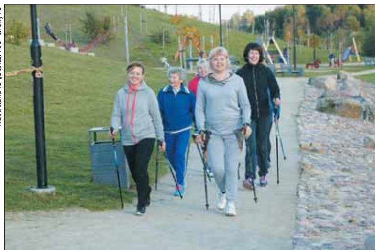
Reguliari mankšta – vienas iš būdų, siekiant sumažinti galimų traumų rizikas.

kuriomis siekiama pakeisti visuomenės požiūrį ar elgesį. Tai vaikų eismo saugos mokymas, saugaus elgesio vandenyje ir prie vandens pamokėlės, paskaitos būsime tėvams, visuomenės sveikatos specialistų, dirbančių vaikų ugdymo įstaigose, kvalifikacijos kėlimas.