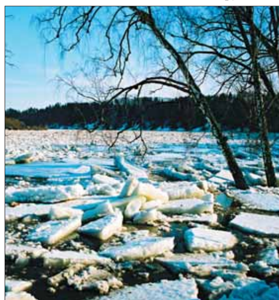
Nemunas ties Birštonu 1999 metais.

pritrūko gal 70 cm, tačiau buvo labai neįjauku. Esant kritiniams atvejams vandens lygi Nemune padėdavo sureguliuoti Kauno HE, atidarydama daugiau šliuzų. Vanduo sukildavo ledą, jį suaižydavo, ir lytis ramiai išplaukdavo, – A. Trakys prisiminė ir didįjį 1999 metų potvynį kurorte, kuomet didžiulės ledų lytys, užneštos ant krantinės, pasigėrėti vaizdu išviliojo daugybę žmonių (nuotrauka kairėje).