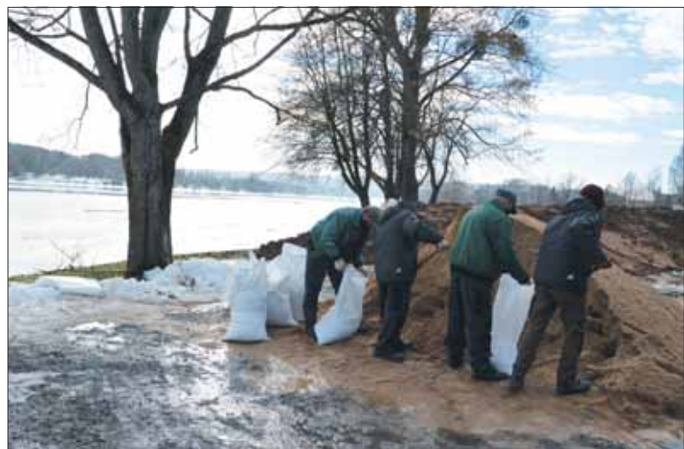
Prienuose, šalia Kęstučio gatvės įrengtoje viešojoje poilsio erdvėje, atsargai ruošiamas molio ir smėlio maišų pylimas, kuris potvynio metu apsaugotų valtines pastatų.