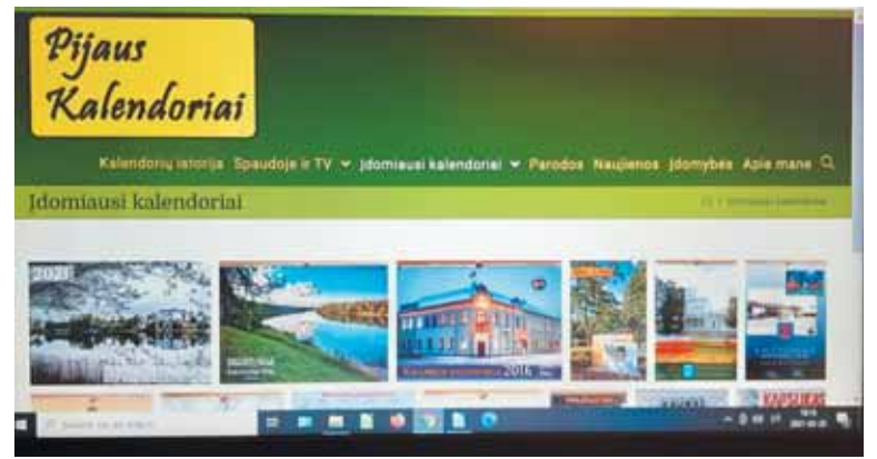
Internetinis puslapis pijauskalendariai.lt