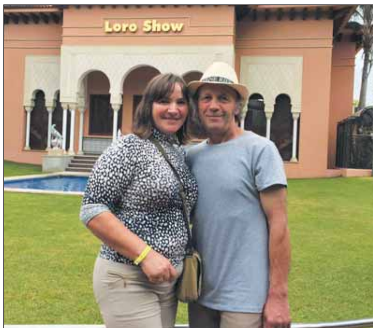
Puslapį parengė Palma Pugačiauskaitė

Mes nesipykstam. Svarbiausia išsakyti vienas kitam ne tik tai, kas gerai, bet ir kas blogai, kalbėtis atvirai. Na, o moterims galbūt reikia tiesiog nebūti piktoms ir mokėti branginti bei puoselėti šeimos židinio ugnelę.