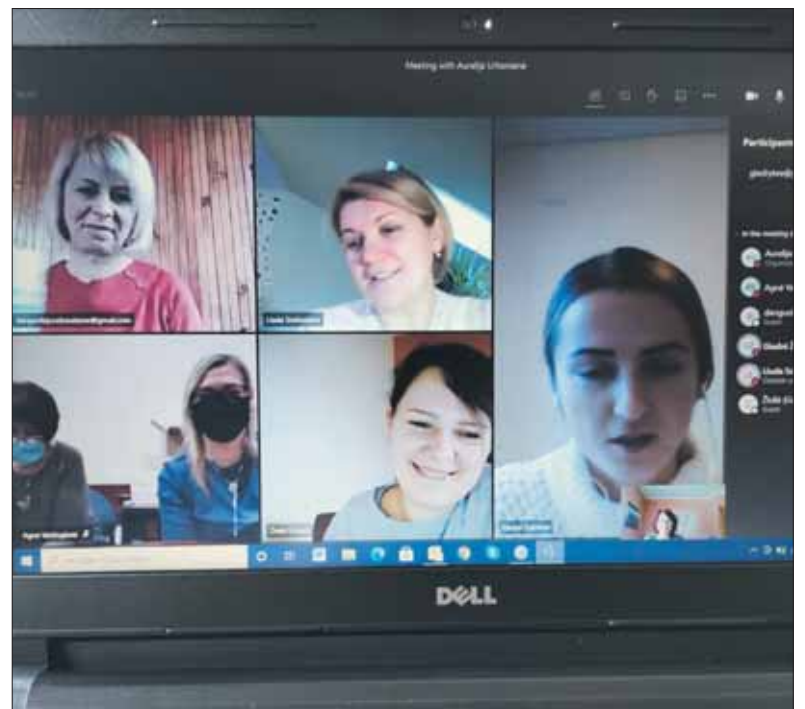
Nuotolinio posėdžio metu.

Socialinių paslaugų centro socialinės darbuotojos, geranoriškai įsitraukusios į kovą su koronavirusu fronto priešakines gretas, (Nukelta į 8 p.)