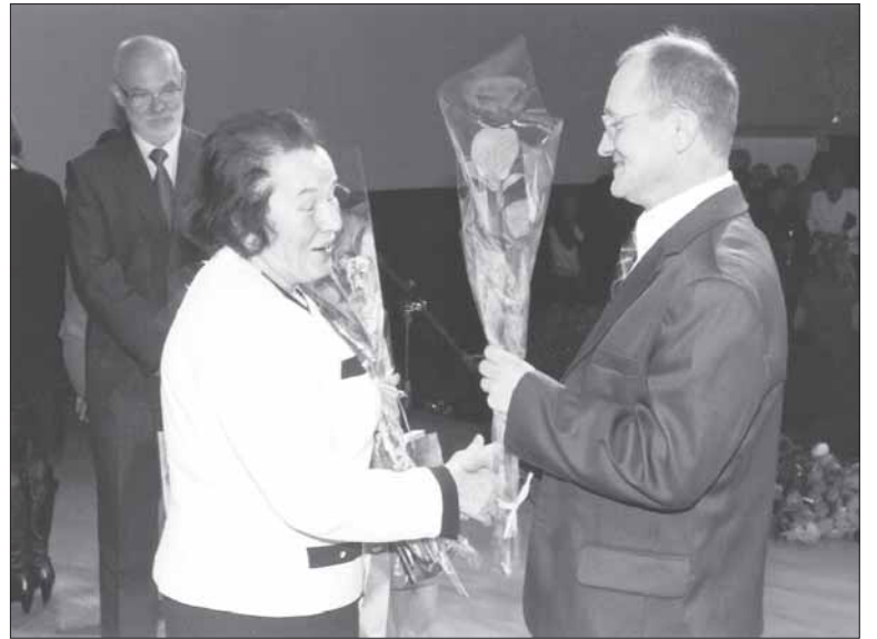
2013 m. Knygos „Žmonės ir darbai Prienu ir Birštono krašto šviesuoliai“ pristatymo metu Birštono kultūros centre.

„Buvau mažas rėksnys. Nutildavau tik gavęs knygą ar sąsiuvinį, taip sudraskiau visus mamos užrašus ir eilėraščius, rašytus jai mokantis Balbieriškio mergaičių žemės ūkio mokykloje. Vėliau mokė tėvas. Man įbrukdavo knygą, pamokydavo raides rašyti. Penkerių metų mokėjau ne tik skaityti ir rašyti, bet ir savitą požiūrį į pasaulį turėjau,“ – taip rašytojas pristato save interviu knygai „Prienu krašto šviesuoliai“.