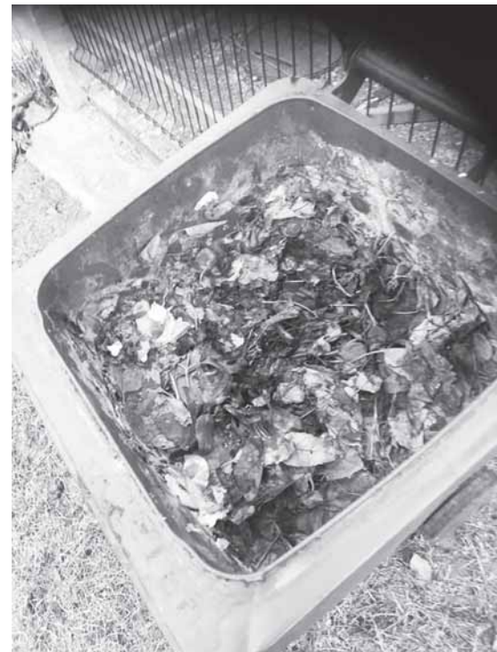
Šaltuoju metų laiku visas atliekas į konteinerius reikia mesti surinktas į maišelius.

Svarbu prisiminti, kad į maisto atliekų kontei-