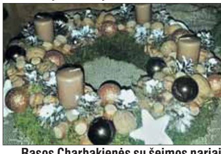
Rasos Charbakienės su šeimos nariais sukurtas adventinis vainikas.