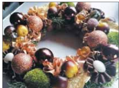
Laimutės Butkienės adventinis vainikas.