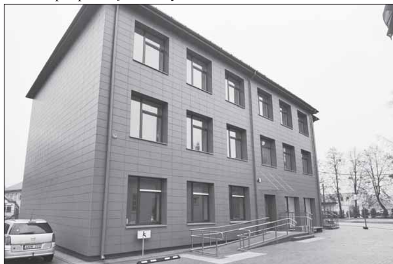
Bendruomenių namai Prienuose.

– Dėkoju už pokalbį. Parengė Dalė Lazauskienė