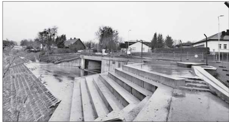
Apžvalgos aikštelė prie Nemuno.

ėmėsi lyderystės ir rūpinosi apsaugos priemonių įsigijimu ne tik biudžetinėms, bet ir ne Savivaldybės pavaldumė esančioms privačioms medicinos įstaigoms, organizavo gyventojų izoliaciją, parvežimus iš oro uostų, perkėlų ir pan.