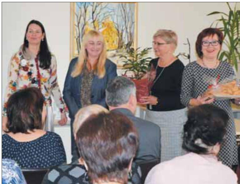
Iš diabeto klubo „Versmė“ veiklos metraščio. 2018 m.

Šio projekto įgyvendinimas pagerins birštoniečių gyvenimo kokybę.