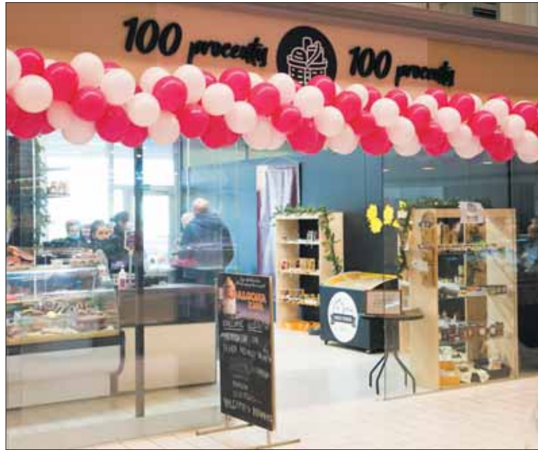
UAB „Miglūnas“ kartu su partneriu „Smile snacks“ prieš dvi savaites Kauno urmo bazės turgavietėje atidarė parduotuvę-kavinę.

– Siekiame, kad užsukę į „100 procentų“, pirkėjai viską, ko reikia surinkti maisto krepšeliui, rastų vienoje vietoje ir, taupydami savo laiką, mūsų parduotuvėleje apsipirktų. Turime įvairių užtepėlių užkandžiams, fasuotų ir sveriamų rūkytos mėsos gaminių, keptų karkos vyniotinių. Čia pat mūsų klientai gali įsigyti duonos, kavos, arbatos, desertui – įvairių skanumynų, džiovintų vaisių. Veikia ir kavinė, kurioje ruo-