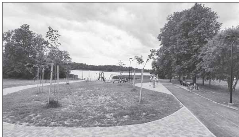
Jiezno laisvalaikio erdvė.