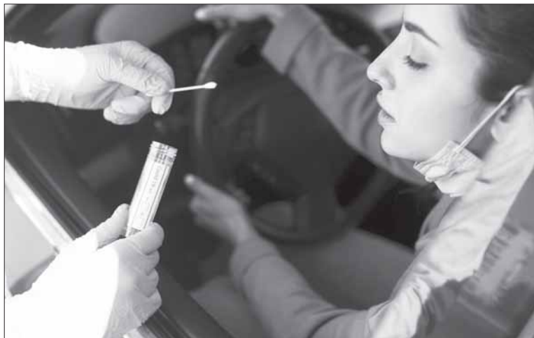
Pastaruoju metu Lietuvą kaustant koronaviruso (COVID-19) pandemijai, kaip niekad reikalingas piliečių budrumas ir atsakingumas.

Dėl duomenų apsaugos karštosios linijos 1808 operatoriai negali užregistruoti asmens tyrimams, jei skambina ne jis pats. Tai padaryti galima tik tada, jei registruojate nepilnametį arba asmenį, kurį globojate, ir ši globa yra iforminta teisiškai.