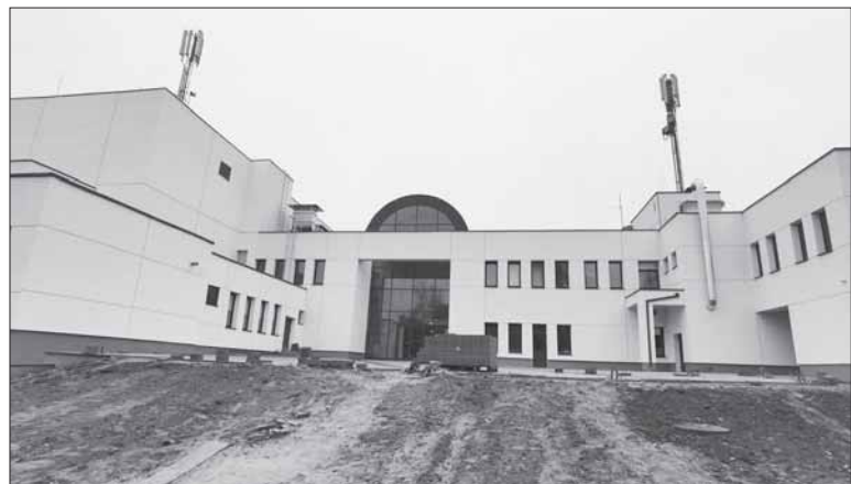
Baigiama Prienujų kultūros ir laisvalaikio centro renovacija.

– Ši neeilinė situacija tikrai pareikalavo didesnio susitelkimo ir bendro darbo. Mūsų Ekstremaliųjų situacijų operacijų centras koordinuoja veiksmus ir sprendimus, kurie reikalingi protruikiui suvaldyti. Jau nuo pat pradžių Savivaldybė