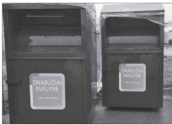
ARATC jau įsigijo ir netrukus miestuose pradės statyti naujus tekstilės atliekų konteinerius, kurie skirti dar tinkamiems naudoti drabužiams ir avalynei surinkti.

Iš gyventojų visos tekstilės atliekos rūšiavimo centruose priimamos nemokamai. Įmonėms už jų tvarkymą yra taikomas nustatyto dydžio mokestis – 80