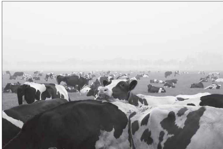
Daugeliui ūkininkų parama tampa paspirtimi plėsti ir modernizuoti savo ūkį.

Pagal priemonės veiklos sritį birželį pateiktų paraiškų prioritetinėje eilėje atsidadė 951 paraiška. Paraiškų rinkimo etapui skirtos paramos pakako finansuoti 728 pro-