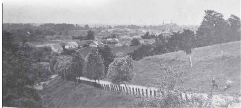
Balbieriškis nuo Marijos kalno 1915 m.