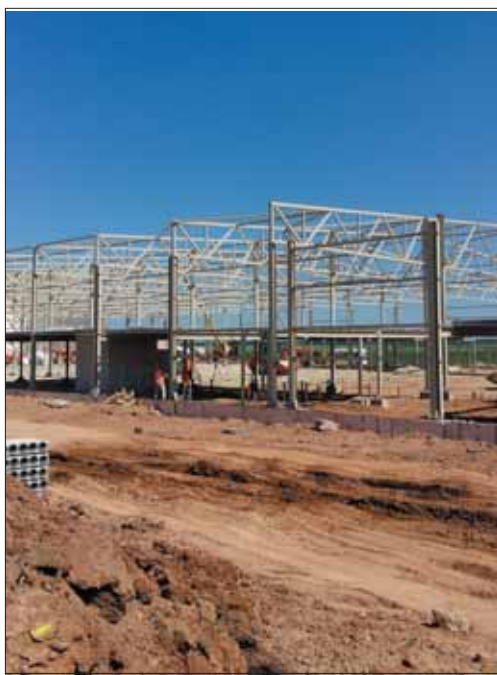
Žemės ūkio bendrovė „Delikatesas“ paukščių skerdyklai statyti sulaukė 4 mln. eurų paramos.

Joniškio rajone jau kyla moderni, viena didžiausių Lietuvoje paukščių skerdyklų. Statomi ir gamybinis bei sandėliavimo pastatai. Skerdykloje planuojama pagaminti 30 tūkst. tonų paukštienos