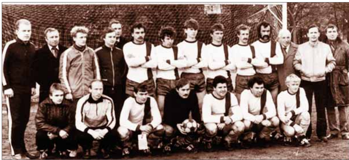
Birštono „Vermės“ futbolo komanda.