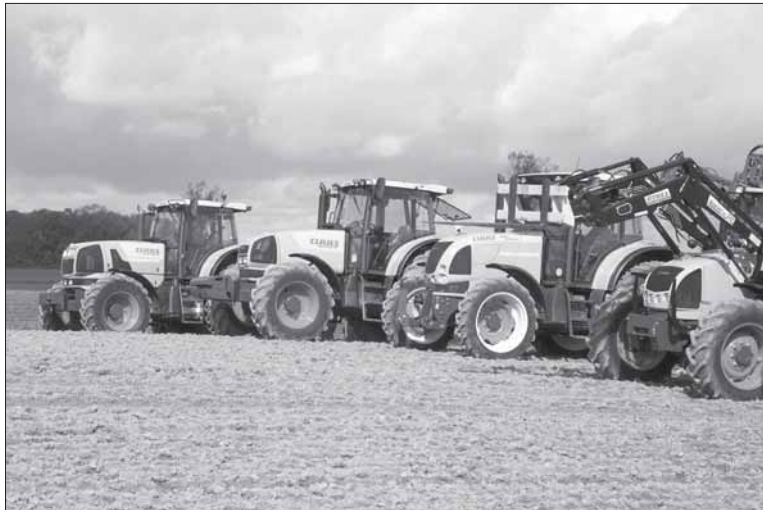
Ši parama ūkininkams yra išties naudinga: investicijos į naują žemės ūkio techniką tampa mažesnės, be to, dirbant su nauja technika, pagerėja darbo našumas.

Jeigu pareiškėjas gyvulininkystės, sodininkystės, uogininkystės, daržininkystės ar augalininkystės sektoriuose nėra pasinaudojęs parama pagal KPP priemonę „Žemės ūkio valdų