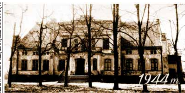
Daukšgiagirės dvaras 1944 m.