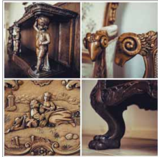
Dvaro interjero detalės.