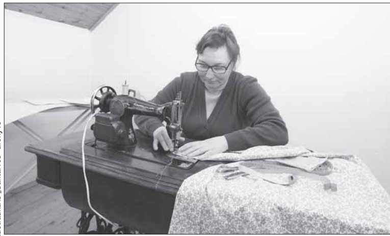
Parama pagal KPP priemonę teikiama pradėti ne žemės ūkio veiklą, atitinkančią Ekonominės veiklos rūšių klasifikatoriuje nurodytas veiklas.

Parama pagal KPP priemonę teikiama pradėti ne žemės ūkio veiklą, atitinkančią Ekonominės veiklos rūšių klasifikatoriuje nurodytas veiklas. Įgyvendinant vieną projektą galima numatyti keletą remiamų ekonominių veiklos rūšių. Jei projekte numatoma, kad bus užsiimama produktų gamyba, apdorojimu, perdirbimu, šios veiklos galutinis produk-