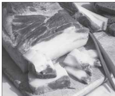
UAB „Miglūnas“ produkcija.