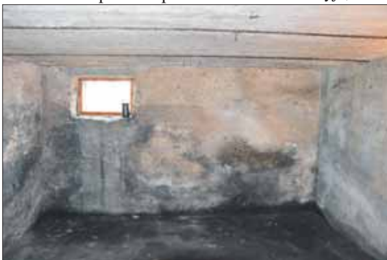
Atverta laikinojo sulaikymo kamera su sienose įrėžtais kalėjusių žmonių įrašais.