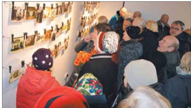
Vietos gyventojai ir svečiai su įdomumu peržiūrėjo eksponuojamas pokario metų nuotraukas.