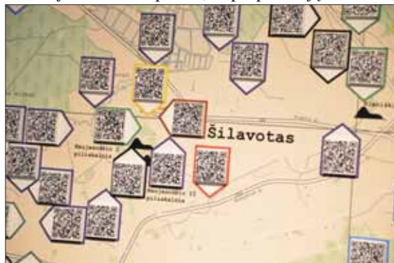
Interaktyvus žemėlapis su Geležinio Vilko partizanų rinktinės istorija, kurioje atsispindi ir kovos Šilavoto krašte.