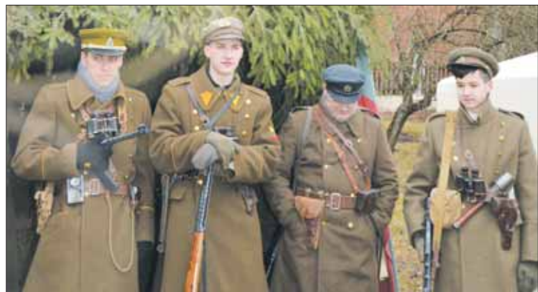
Tėvynės ginti išėjo jauni ir gražūs... Karo istorijos klubo „Partizanas“ rekonstruktoriai.