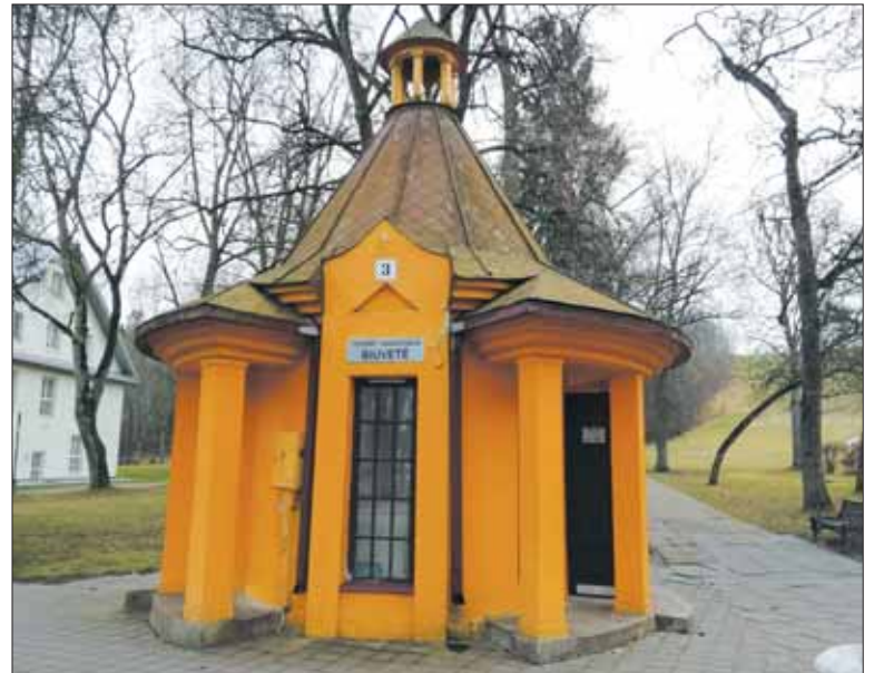
„Tulpės“ sanatorijos biuvetė.

Šiuo metu istorinis, 40 metrų aukščio Vytauto kalnas savo grožiu