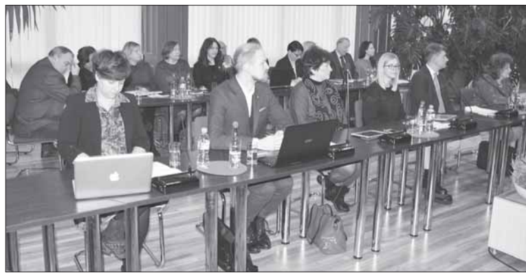
Politikams teko priimti nepopuliarius sprendimus: panaikinti vietinės rinkliavos lengvatą privačių namų savininkams ir padidinti mokesčių juridiniams asmenims.

„Mes buvome pateikę savo sprendimo projektą, Savivaldybė turi kitų skaičiavimų. Manome, kad vietinės rinkliavos lengvatų individualių namų savininkams panaikinimas yra racionalus būdas suma-