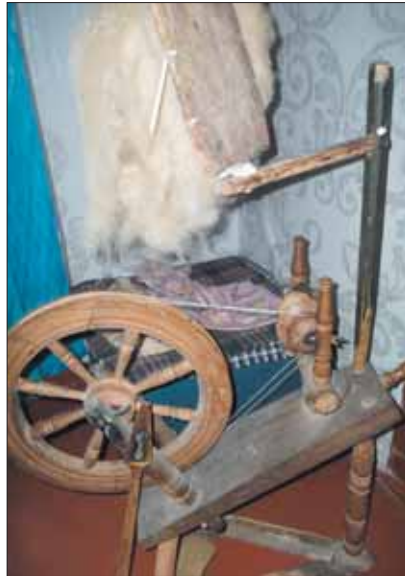
Genutės darbo įrankis, sako, jau kiek ir pabodęs per gyvenimą...