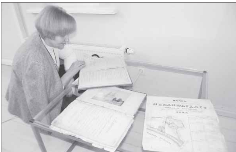
Prie Nemajūnų bažnyčios knygų fragmentų.

Kaip pasakojo skaitmenininkai, buvo labai įdomu vartyti knygas, kuriose pateikta ne tik statistiniai duomenys, bet esama ir kitokių paliudijimų. Pavyzdžiui, iš Musninkų bažnyčioje išsaugotos Sv. Marijos Rožinio brolijos knygos galima sužinoti ir apie vykdytas veiklas. Pasirodo, Musninkų bendruomenės būta labai aktyvios, net ir maro metais vy-