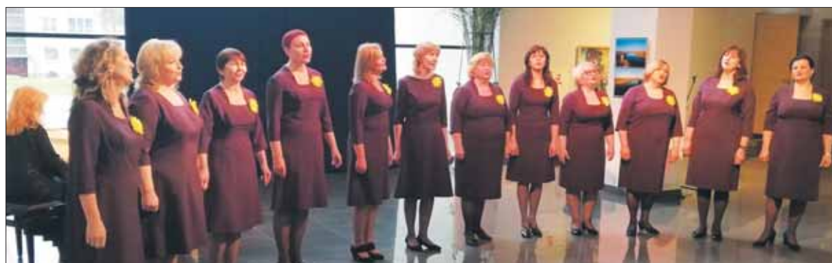
Prienų kultūros ir laisvalaikio centro moterų vokalinis ansamblis „Pienė“ savo kraštu „Sidabrinuose balsuose“ atstovaus jau ne pirmą kartą.

„Norėčiau pasidžiaugti, jog visi išdrįsote dalyvauti šiame konkurse.