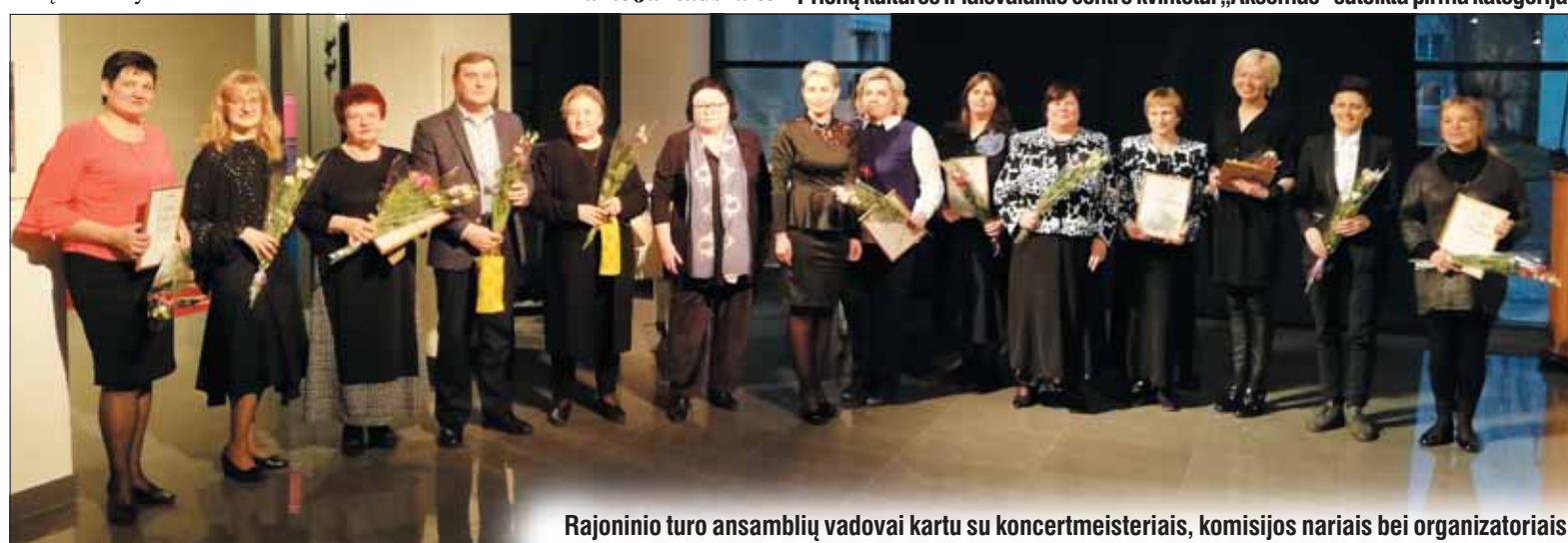
Rajoninio turo ansamblių vadovai kartu su koncertmeisteriais, komisijos nariais bei organizatoriais.