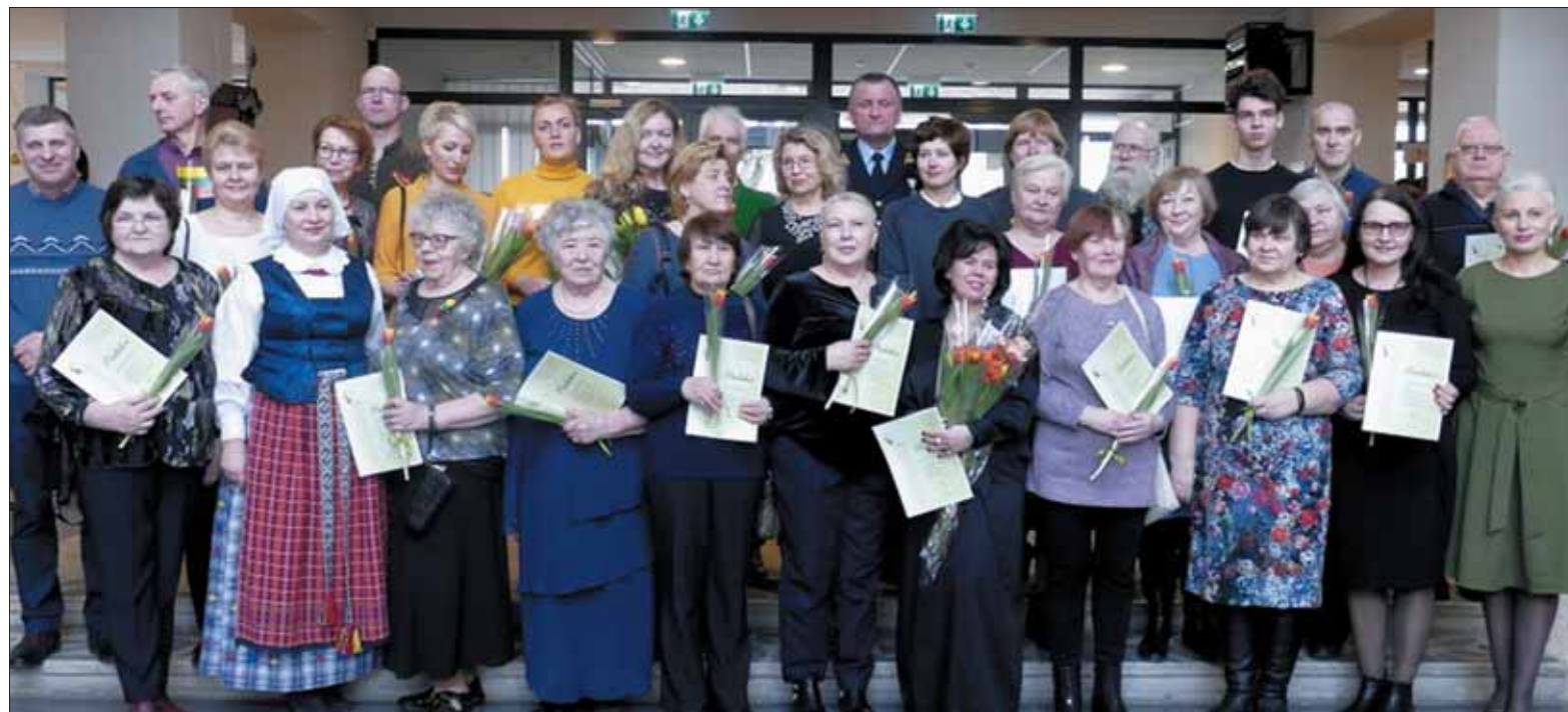
Tautodailininkų metams skirtos parodos dalyviai.