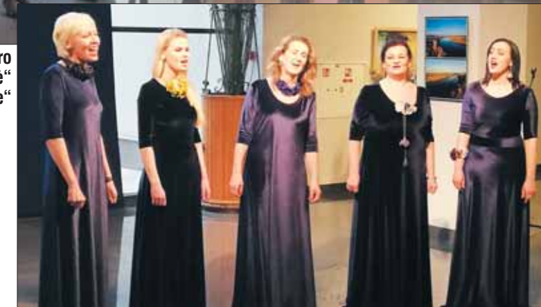
Prienų kultūros ir laisvalaikio centro kvintetui „Aksomas“ suteikta pirmą kategoriją.