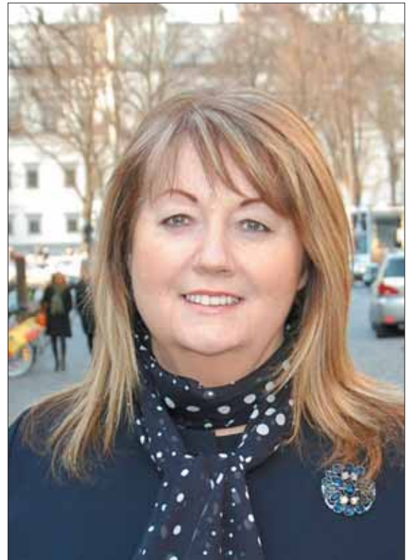
Vilija Blinkevičiūtė: „Pritariu siūlymams didinti MMA. Bet ir padidinus MMA, galima būtų kalbėti tik apie truputį teisingesnį atlyginimą ir padoresnį gyvenimą“.