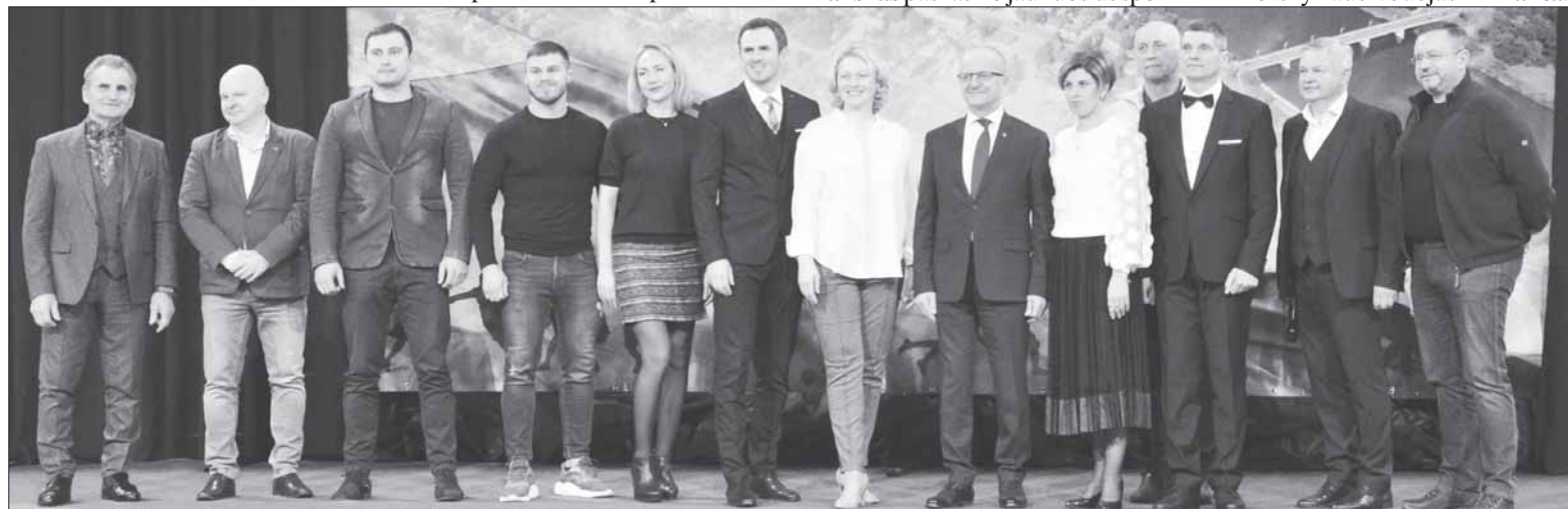
Mero padėkos raštus apdovanojami treneriai.

Daugiau nuotraukų: www.facebook.com/laikrasti gyvenimas