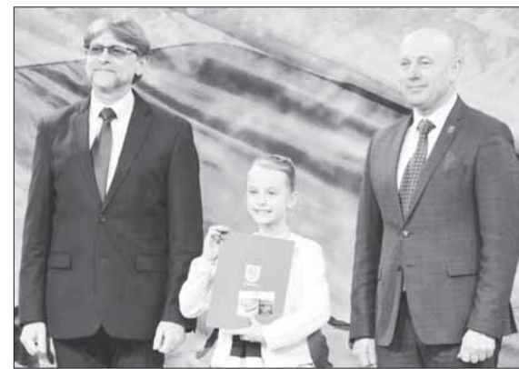
Apdovanojimas – vienai iš perspektyvių gimnasčių.