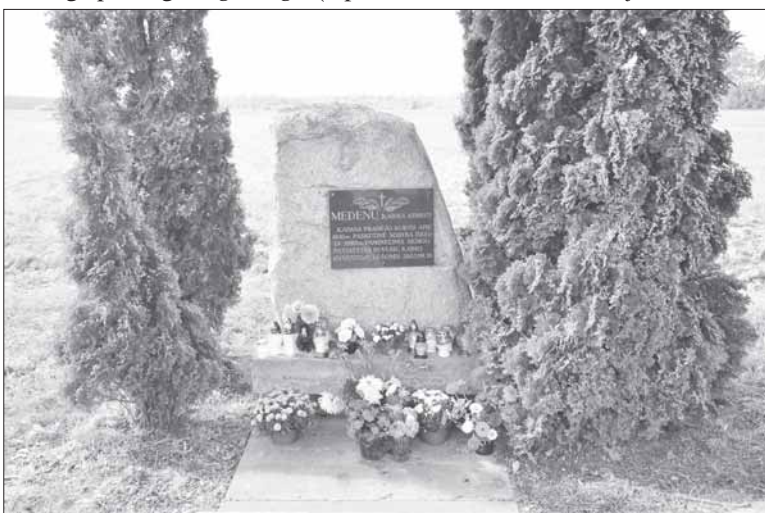
Paminklinis akmuo, skirtas buvusiam Medenų kaimui (Balbieriškio sen.) atminti, pastatytas buvusių jo gyventojų pastangomis.