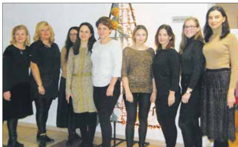
Iniciatyvos „Padovanok suknelę“ organizacinė ir kūrybinė komanda, kurios dėka beveik 20 moterų pasipuošė gražiomis suknelėmis, o šukuosenos ir makiažas buvo sukurti vos per 2 valandas.