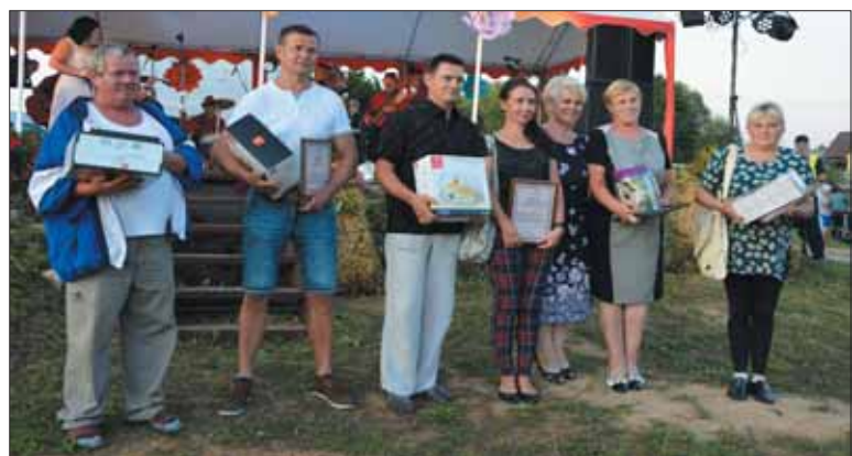
Pagerbti seniūnijos gražiausių sodybų šeimininkai.