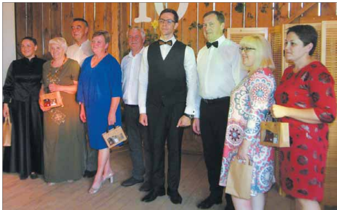
Atminimo dovanos įteiktos ir dešimtmečio šventėje dalyvavusiems Nemajūnų Santalkos, Siponių, Birštono vienkiemio, Vėžionių „Topolio“ ir Škėvonių bendruomenių pirmininkams bei koncertavusių ansamblių vadovams.