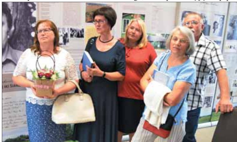
Nauja kraštiečių knyga džiaugėsi ir šilavotiškiai.

Daugiau nuotraukų www.gyvenimas.info