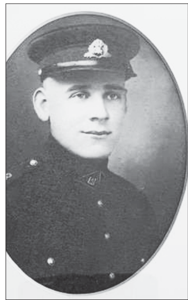
Tėvas – Lietuvos kareivis, 1936 m.

Tėvas įėjo į pavasarininkų miestelio kuopą, kurią globojo bažnyčia. Dabar žvelgiu į tų laikų keliasdešimties pavasarininkų nuotrauką, darytą kokiais 1934 m. Kas jį skatino tokiai veiklai? Mano klasės