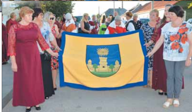
Stakliškių vasaros šventė prasidėjo iškilminga eiseną.