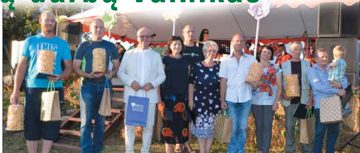
Savivaldybės, seniūnijos, bendruomenės vadovai su medžio drožėjų plenero dalyviais.

Vyšniūnų bendruomenės nariai šventės dalyvius vaišino čia pat, ant tvenkinio kranto, išvirta sriuba, Žel-