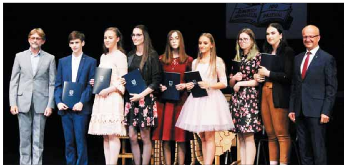
Šimtukus gavo 8 abiturientai.