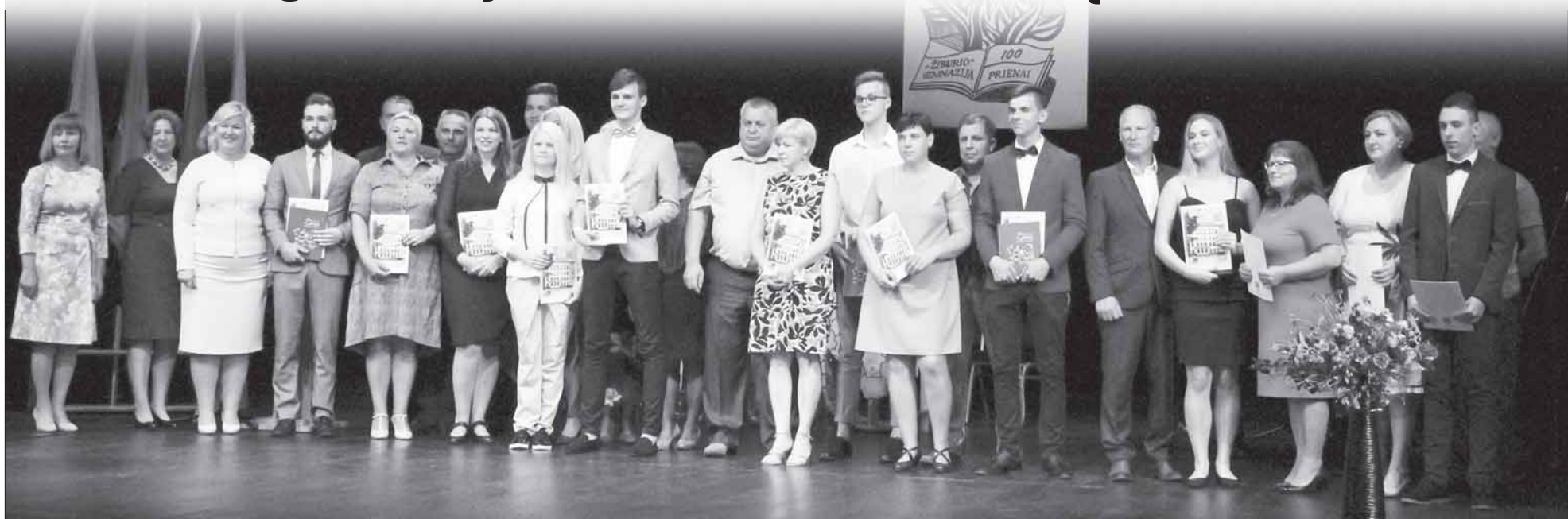
Už sportinius pasiekimus apdovanoti abiturientai ir jų tėvai.