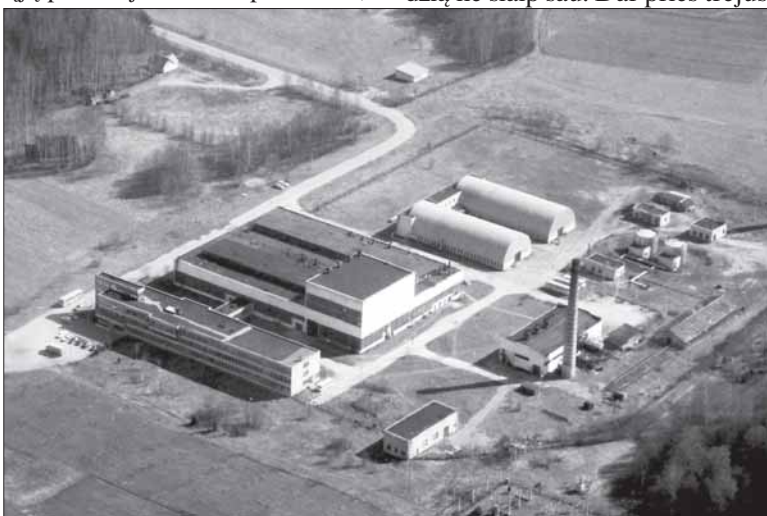
ESAG 1985 m.