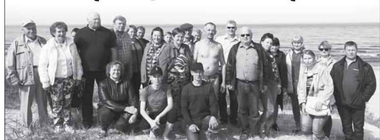
(Atkelta iš 1 p.)

Baltijos jūros pakrante. Tačiau tarp ūkininkų atsirado ir vienas sveikuo- lis, kuris spėjo ir išsimaudyt.