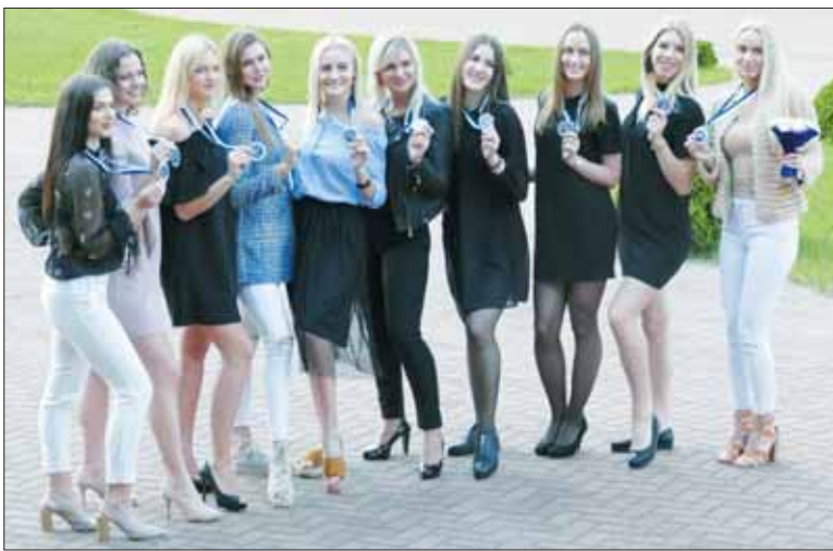
Prienų krepšinio klubo šokėjos.