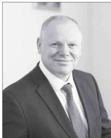
pardavėjomis pasitiki ir yra linkę pasitarti“, – teigia UAB „Gulbelė“ vadovas.

„Pasiruošimas užtruko, nes reikalavimai yra itin griežti. Vienas jų – būtinybė laikyti vaistus kasoje, uždaroje lentyoje, kad būtų matomas tik asortimento sąrašas. Personalas taip pat buvo specialiai apmokytas – pardavėjos negalės klientams nei patarti, nei pasakoti apie prekę, o tik ją parduoti. Tai sudėtinga, nes regionų pirkėjai