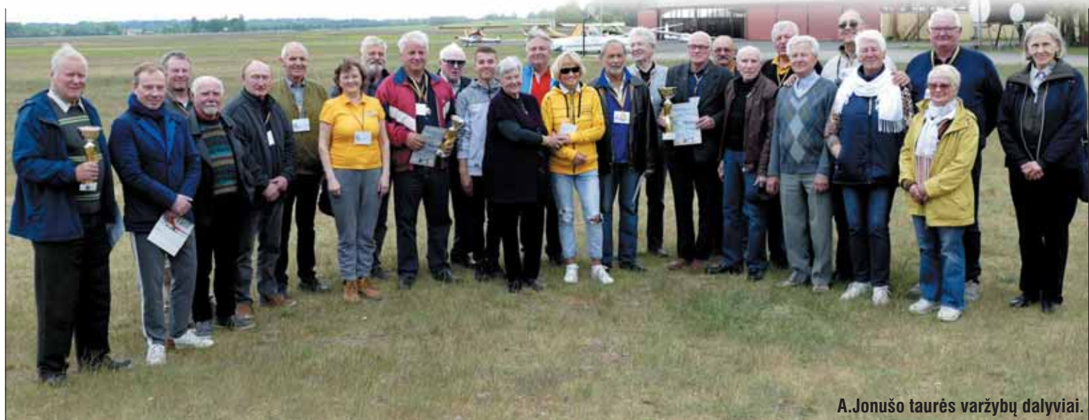
A.Jonušo taurės varžybų dalyviai.