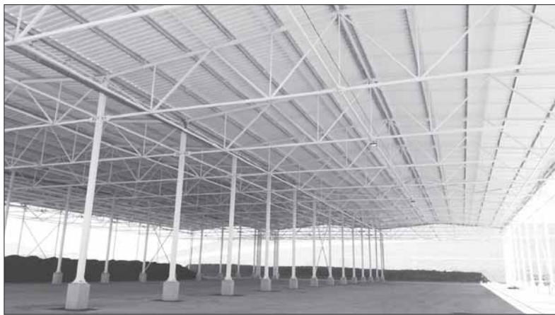
Didžiausia ARATC sistemos kompostavimo aikštelė, atsižvelgus į specialistų rekomendacijas, uždengta, užkertant kelią nuotekų taršai ir blogo kvapo susidarymui.

„Tai buvo labai tikslinga ir prasminga investicija, padėjusi išspręsti ir blogo kvapo, ir aplinkos taršos nuotekomis problemą, ir leisianti ateityje taupyti, nes esant sausam orui organinių atliekų kaupus rei-