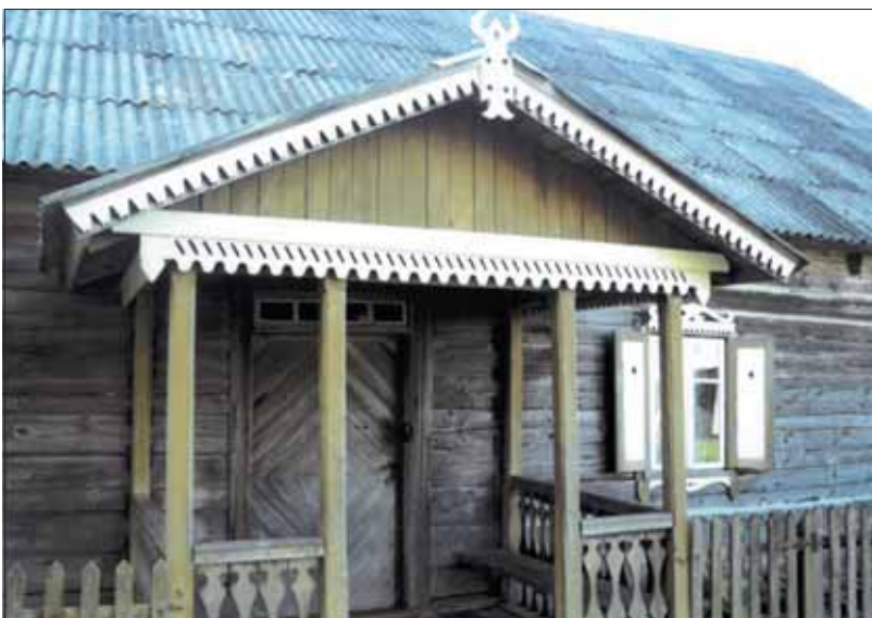
Skaudžių namo fragmentas ir buvęs Būblių, dabar Gusų namas.