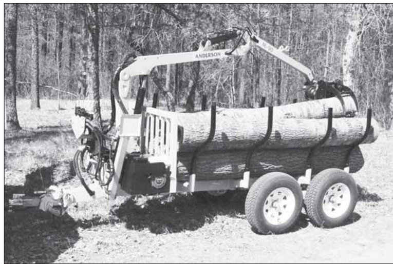
Už gautą sumą, siekiančią beveik 100 tūkst. Eur, A. Vainauskas planuoja įsigyti modernios miško technikos.

Už gautą paramą galima įsigyti naują miško kirtimo, apvaliosios medienos ir biokuro ruošos techniką bei įrangą (motorinius pjūk-