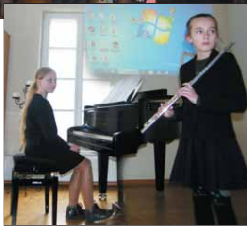
Muzikuoja Veiverių A. Kučingio meno mokyklos jaunosios atlikėjos.